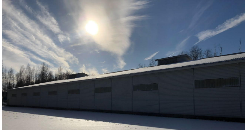
Harjoitteluhalli. Nykyinen julkisivu.