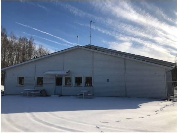
Lisäosa. Ulkokentän pääty.