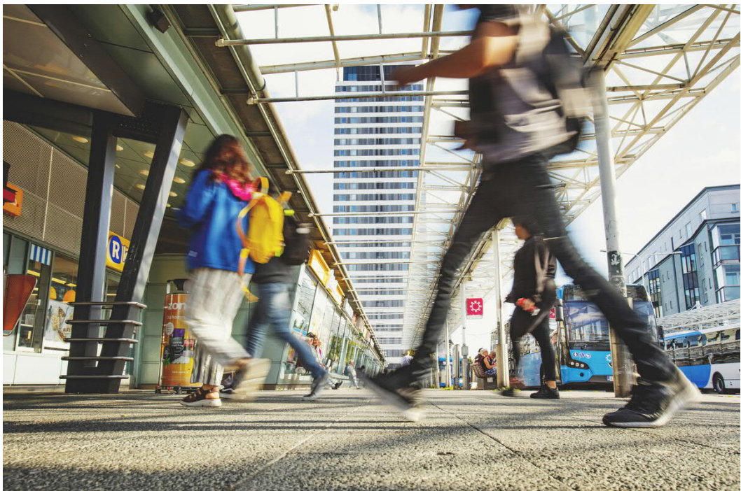
Kuva 5 Kauppakeskus Columbus metroaseman ääressä.

Korttelin suunnittelussa tulee huomioida olemassa oleva kulttuurikeskus Vuotalon ja suunniteltavan laajennusosan huoltoyhteyden toimivuus korttelikonaisuudessa. Korttelin maantasaisten huoltoyhteyksien järjestäminen mahdollisimman vähäiseksi huleveisiä imeyttävillä kujien osuuksilla ja katualueilla on osa suunnittelutehtävää. Suunnittelussa tulee myös muilta osin huomioida olemassa olevien maanalaisten tilojen rakenteet ja järjestelyt.