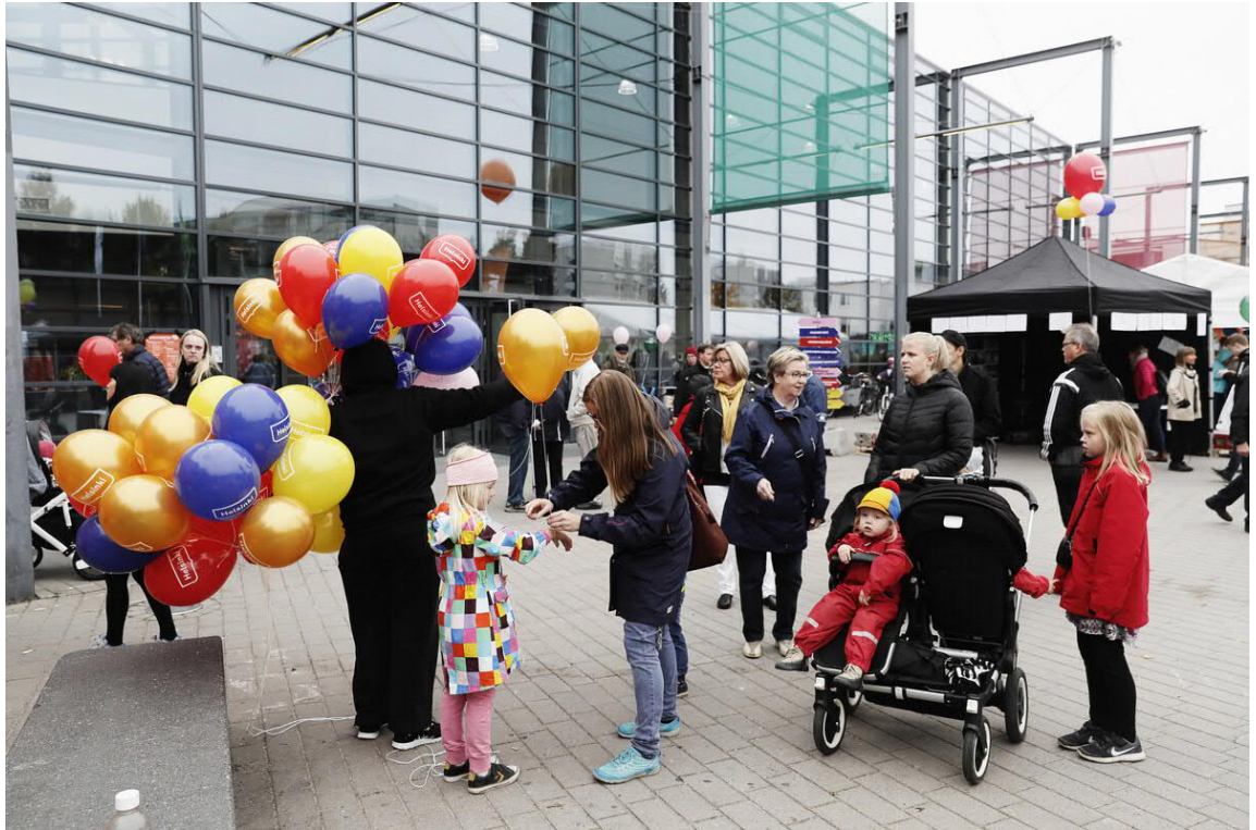
Kuva 3 Vuotalonaukion kehittäminen on osa suunnittelutehtävää.

Kaupunkikuvallisia ja toiminnallisia lähtökohtia esitellään lisää liitteissä 3 ja 4.