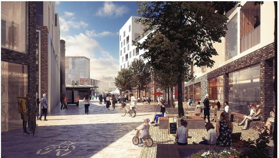
Kuva 4 Toimitilojen sijoittelulla tuetaan katutilan elävyyttä.

Suunnitelmassa tulee osoittaa liike-, palvelu- ja toimistotilaa vähintään 5.000 k-m 2 sekä esittää arvio tilojen kautta syntyvien työpaikkojen määrästä. Liiketilojen sijoittamisessa tulee painottaa korttelin kulmia ja kävely-ympäristön keskeisiä alueita, joissa toiminnan näkyvyys ja vaikutus katutilan elävyyteen on suurinta.