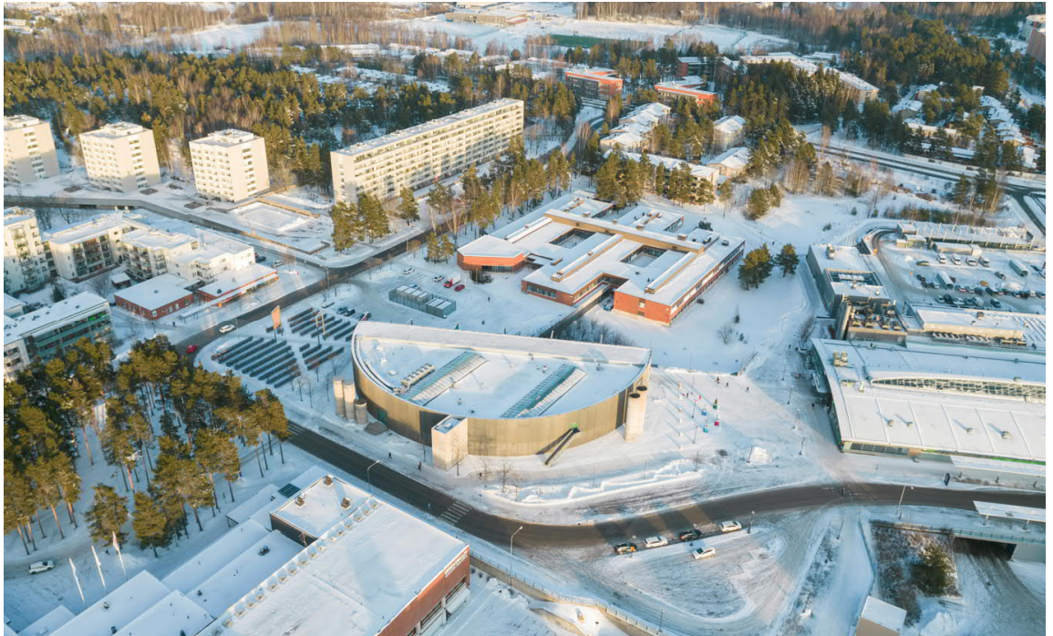
Kuva 6 Vuotalo ja Kulttuurikortteli lounaasta kuvattuna.

Käyntiosoite: Kaupunkiympäristötalo, Työpajankatu 8