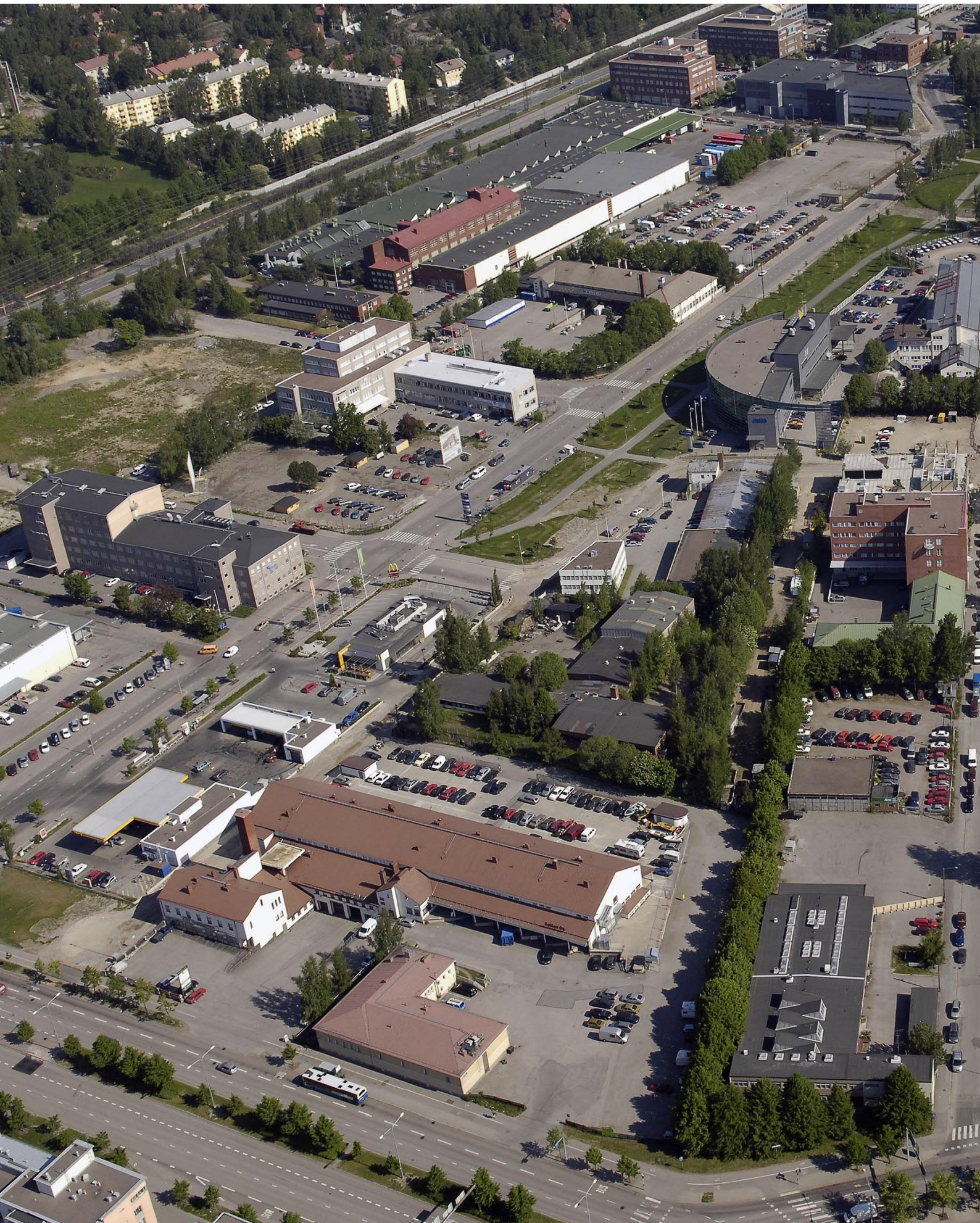
ALUEEN HISTORIAA: Viistoilmakuva alueelta 2006