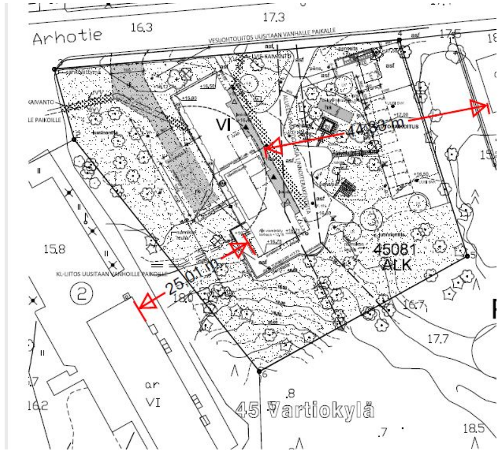
Kuva 2. Karttaliite työmaa-alueesta

Ilmoitus koskee purkutyötä 27.2.–31.10.2023 arkisin maanantaista perjantaihin kello 7.00–18.00 ja lauantaisin kello 9.00–14.00 osoitteessa Arhotie 20 (kuva 2).