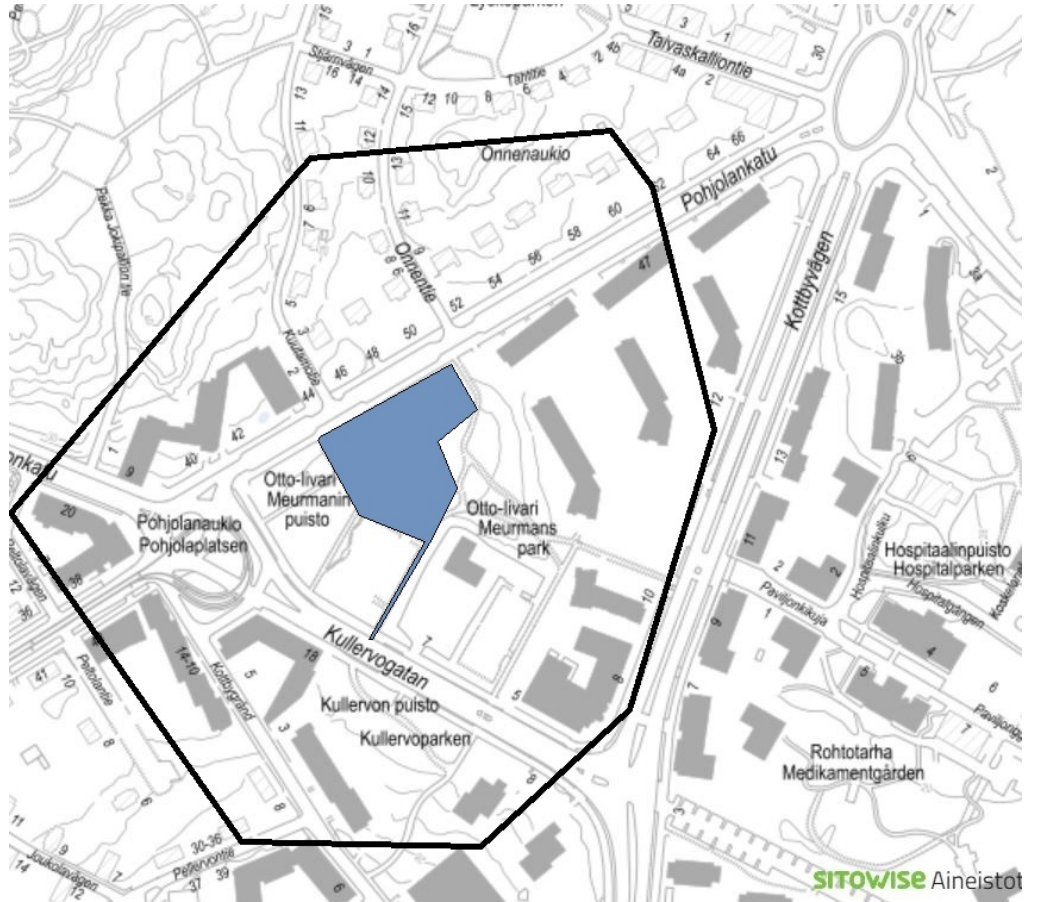
Kuva 1. Työmaan sijainti ja tiedotusalue (määräys 4).