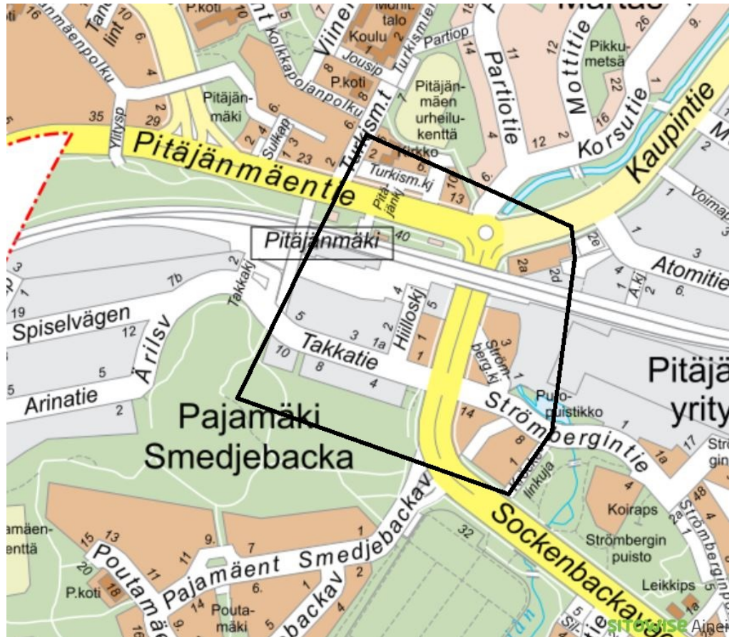
Kuva 1. Tiedotusalue rajattu mustalla viivalla (Määräys 2).