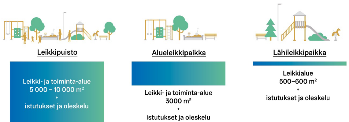
Kuva 2. Uusia leikkipuistoja ja leikkipaikkoja varten tulee varata riittävästi tilaa leikki- ja toiminta-alueille, viheralueille ja oleskelulle.

Kaavassa leikkipuistot ja leikkipaikat on mitoitettu vastaamaan julkisen käytön tarpeita. Yleisellä alueella sijaitsevat puistot eivät voi korvata päiväkotipihaa lasten pääasiallisena ulkoilupaikkana. Lisäksi Helsingissä päiväkotipihojen normit ovat tiukempia kuin leikkipuistojen, alueleikkipaikkojen tai lähileikkipaikkojen, joissa noudatetaan EU-standardeja. Jos yleisten alueiden puistoja muutetaan vastaamaan päiväkotien tarpeita, tulee suunnittelun, rakentamisen ja kunnossapidon kustannusten kohdentua käyttöä vastaavalle taholle.