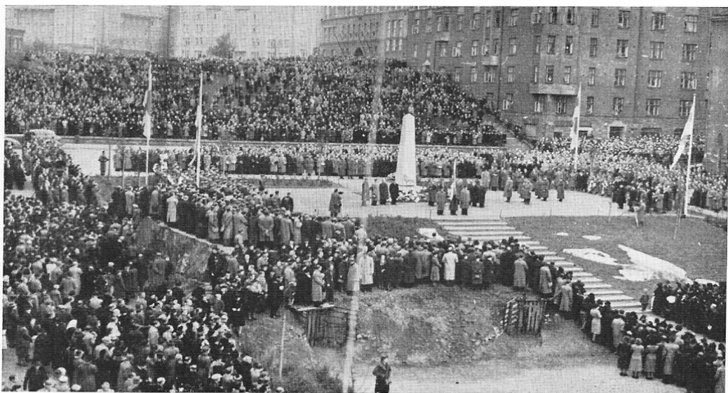
Ässä-rykmentin sankaripatsaan paljastustilaisuus Alli Tryggin puistikossa muodostui mielinpainuvaksi juhlaiksi, jota seurasi parikymmentuhantinen yleisöjoukko.

Kuva 3. Ässä-tie, Suokumaalta Säiniölle ja Petroskoin tieltä Karhumäkeen, Yhteiskirjapaino Oy, Helsinki 1964, s. 50.