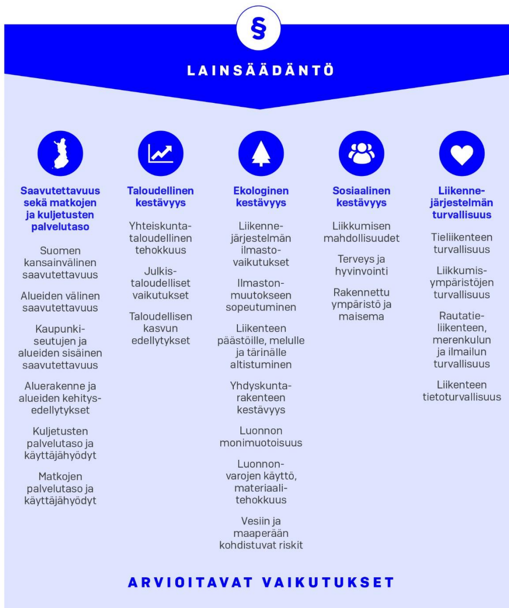
Kuva 3. Arvioitavat vaikutukset (päivitetty 16.3.2020).