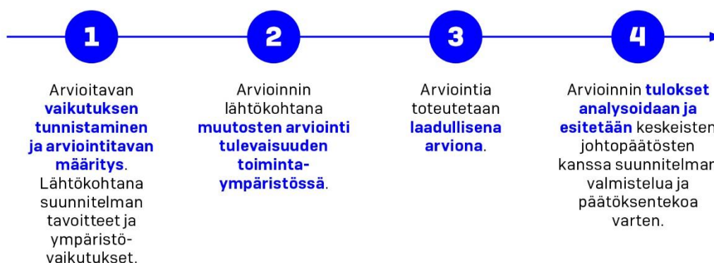
Kuva 4. Vaikutusten arvioinnin eteneminen.

Arvioinnin valmisteluvaiheet on esitetty pääpiirteissään kuvassa 4. Vaikutusten arviointia raamittaa arviointikehikko, johon on kuvattu arvioitavat vaikutusalueet. Vaikutusalueet on kytketty suunnitelmalle asetettuihin tavoitteisiin (liite 2), mikä tehnyt tavoitteiden toteutumisen arvionnista systemaattista ja läpinäkyvää.