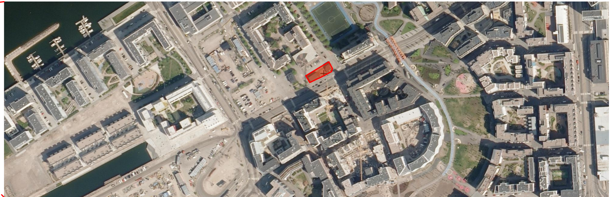
RAKENNUSPAIKAN SIJAINTI KAUPUNKIRAKENTEESSA