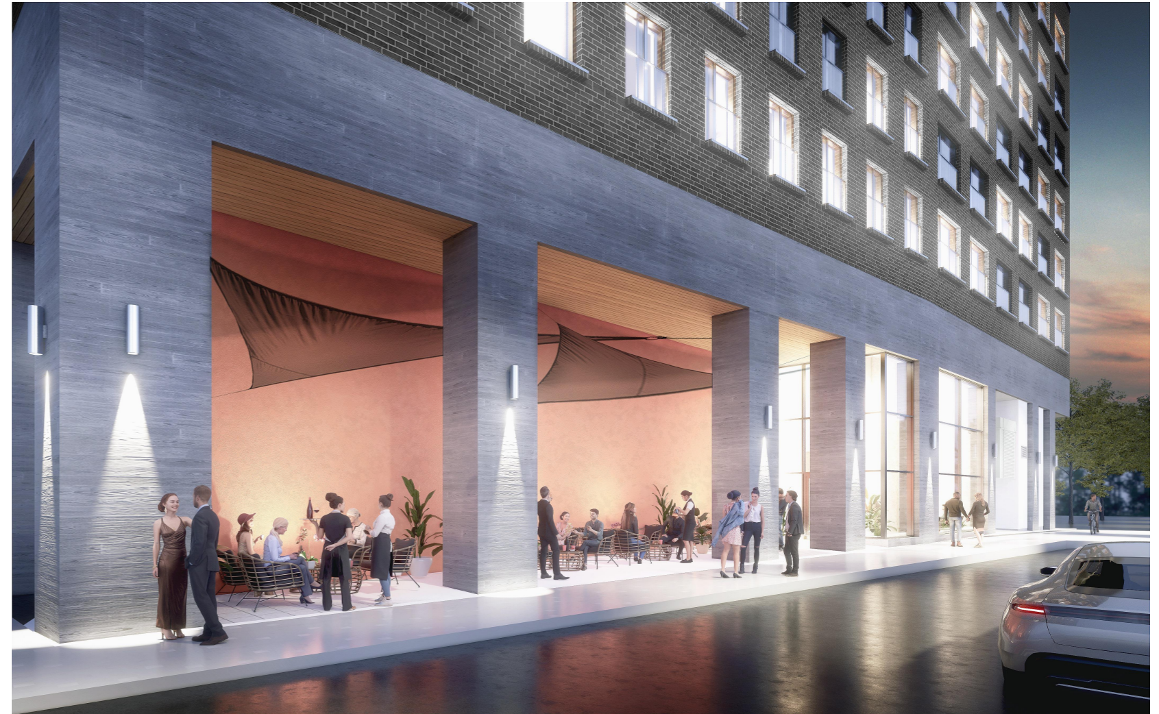
HAVAINNEKUVA NÄKYMÄ VÄLIMERENKADULTA RAVINTOLAN TERASSILLE

Ravintola myös osaltaan mahdollistaa paremman palvelutason lähialueen asukkaille.