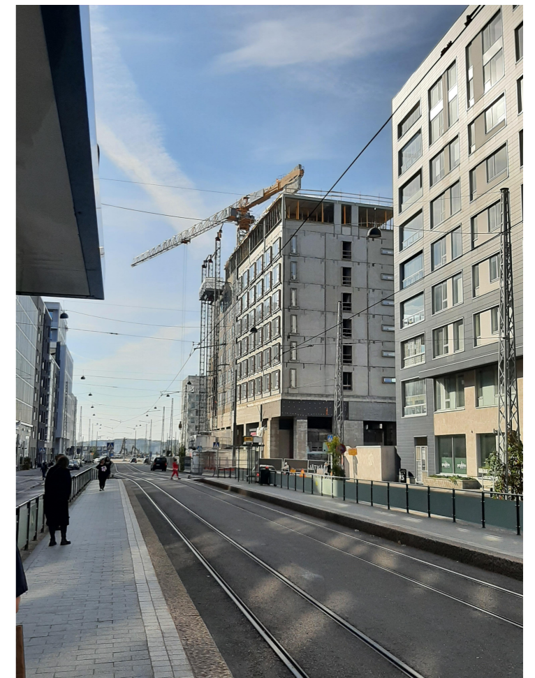
TILANNE TONTILLA 22.9.2023