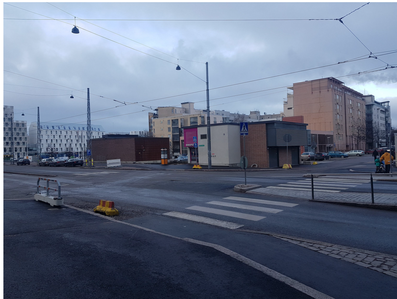
TILANNE TONTILLA ENNEN RAKENTAMISTA