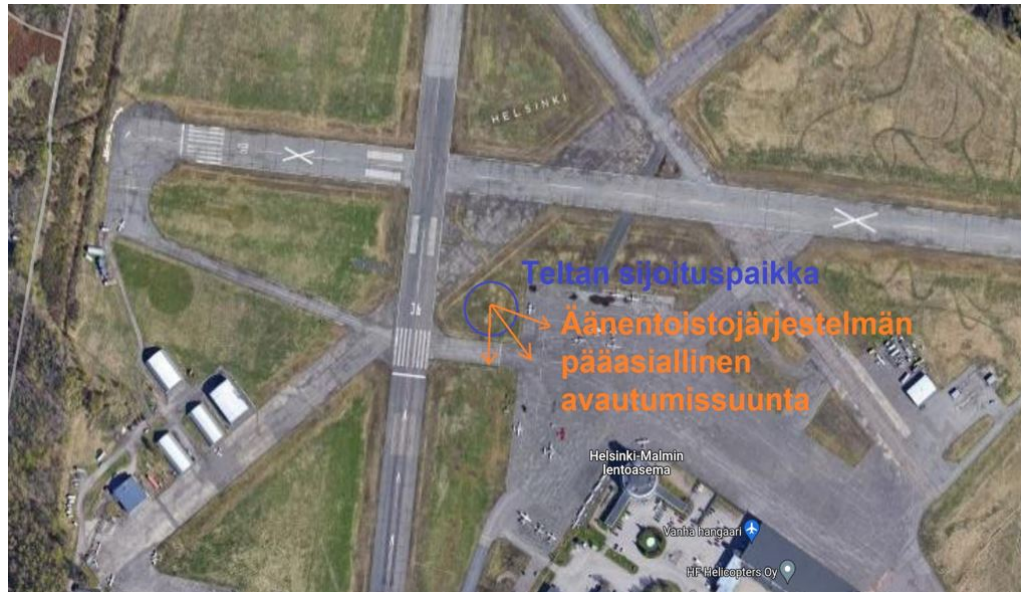
Kuva 2. Äänentoiston suuntaus