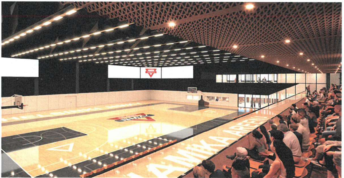
Kuva 5. Areenakenttä