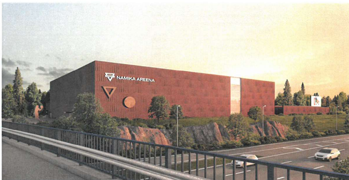
Kuva 3. Julkisivu Kehä 1 ja Pakilantien risteyskohdasta.