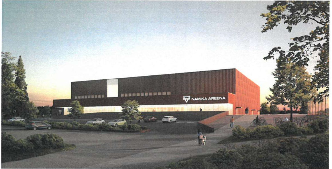
Kuva 4. Julkisivu/Sisäänkäynti Pilkekujalta.