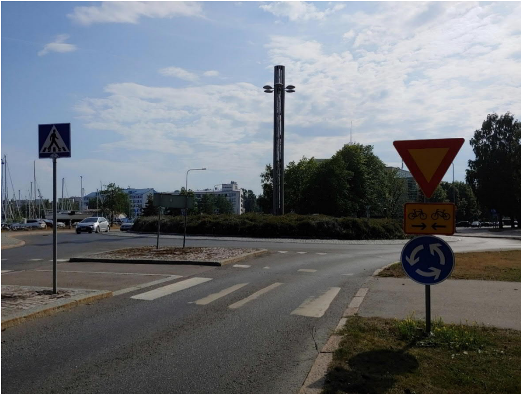
Kuva 2 ja 3: Kiertosaarekkeen halkaisijan ollessa 20 metriä, pysähtymisnäkemän minimi on 15 metriä. Kuvakaappausten lähde Kaupunkitilaohje.