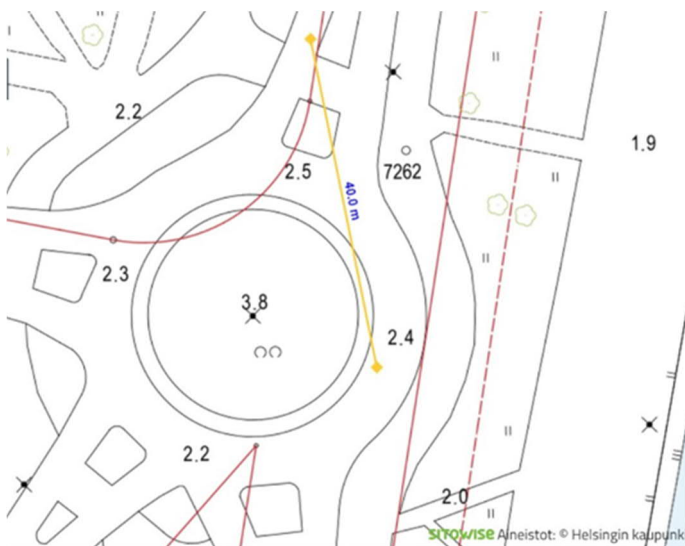
Kuva 4: Ote karttapalvelusta, kartta.hel.fi