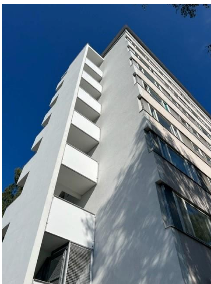
Rakennuksen eteläpääty ja länsipuoli.