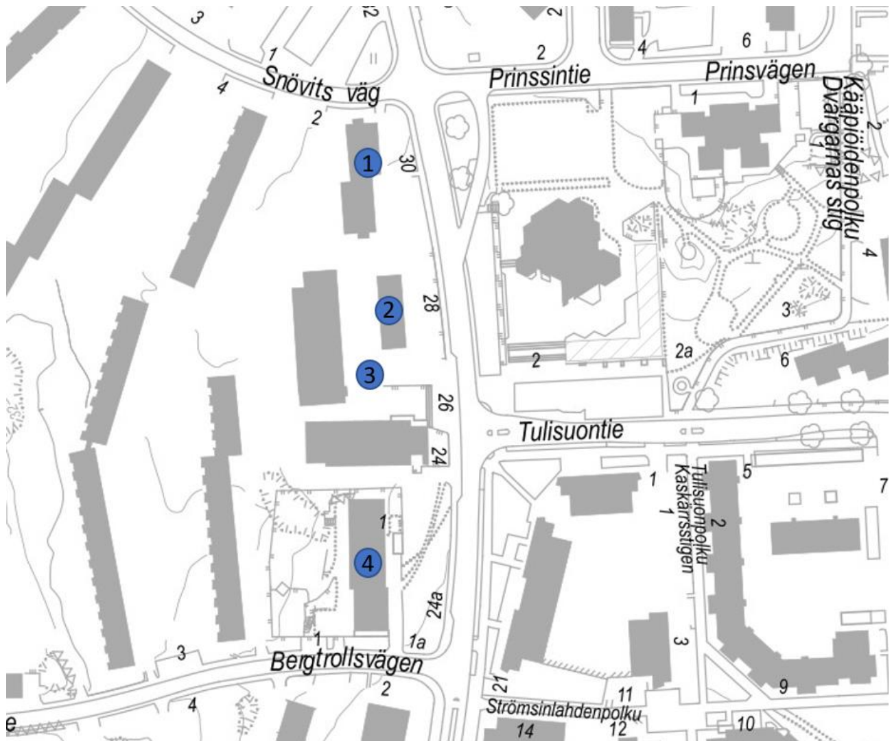
Suojellut kohteet kartalla