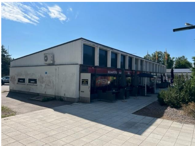
Rakennuksen pohjoispääty ja itäpuoli.

Rakennustaiteellisesti, historiallisesti tai kaupunkikuvallisesti arvokas suojeltava rakennus. Suojelu koskee rakennuksen julkisivuja ja vesikattoa sekä sen julkisia sisätiloja. Rakennuksessa tehtävät korjaustyöt ja muutokset eivät saa heikentää sen arvoa tai hävittää sen ominaispiirteitä. Rakennusta ei saa purkaa. Ohjeellisella KL/s-tontilla (43214/14) rakennuksen katon palkkirakenteet sekä yläikkunoiden asema suhteessa sisätilaan tulee säilyttää.