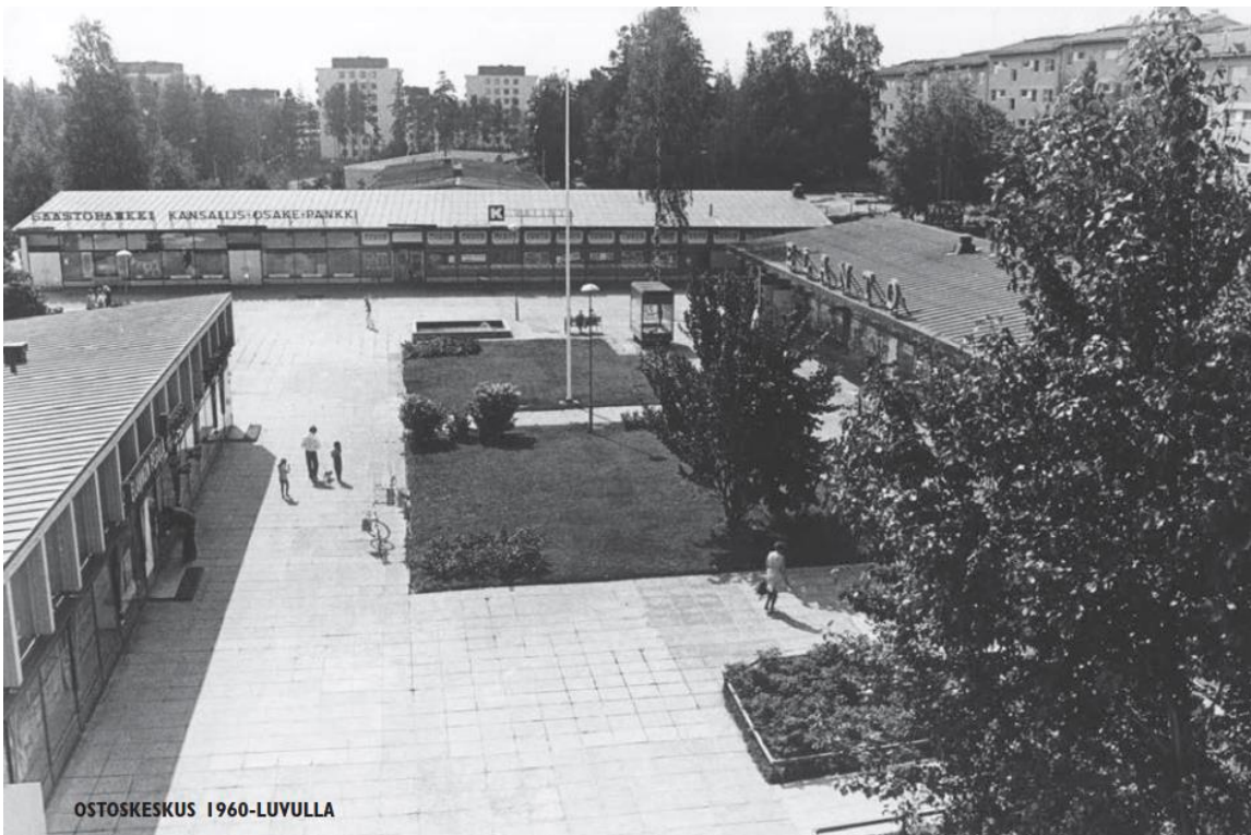
Arkistokuva. Alkuperäinen aukionäkymä pohjoisesta.