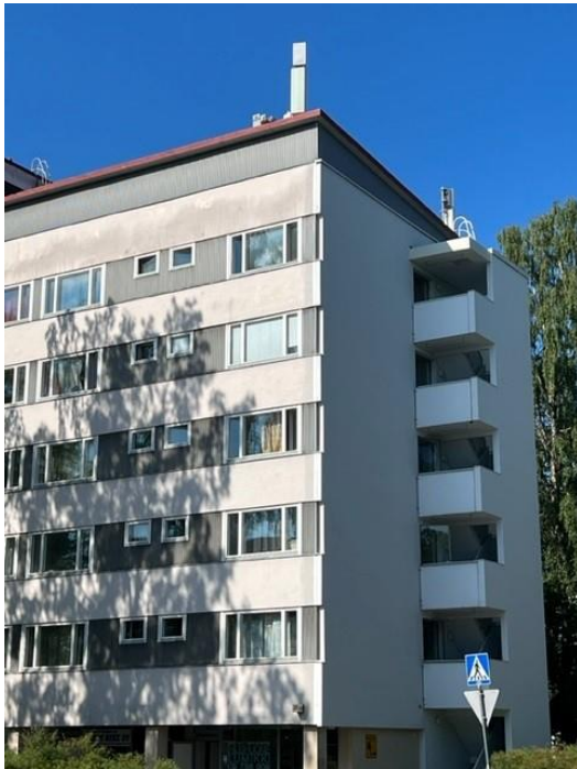
Rakennuksen pohjois- ja itäpuoli.

Rakennustaiteellisesti, historiallisesti tai kaupunkikuvallisesti arvokas suojeltava rakennus. Suojelu koskee rakennuksen julkisivuja ja vesikattoa sekä sen julkisia sisätiloja. Rakennuksessa tehtävät korjaustyöt ja muutokset eivät saa heikentää sen arvoa tai hävittää sen ominaispiirteitä. Rakennusta ei saa purkaa. Ohjeellisella KL/s-tontilla (43214/14) rakennuksen katon palkkirakenteet sekä yläikkunoiden asema suhteessa sisätilaan tulee säilyttää.