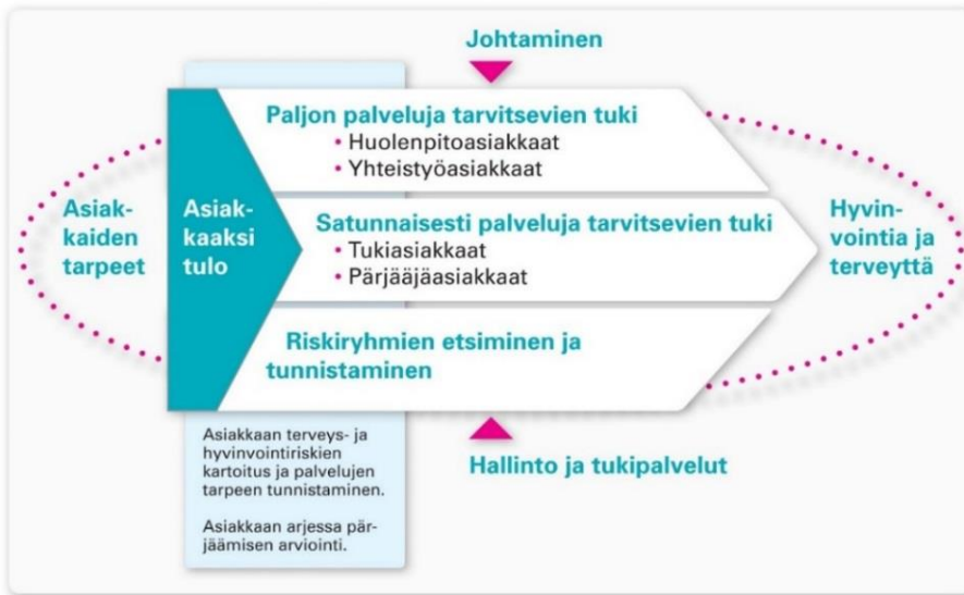
Kuvio 1. Sosiaali- ja terveysviraston prosessikartta