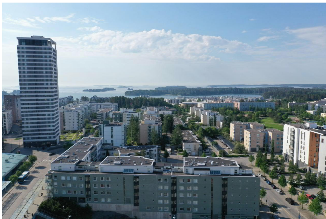
Kuva 2. Näkymä Mosaiikkikorttelista etelään noin 50 metrin korkeudesta.

Keskeisen sijainnin myötä Mosaiikkikorttelin maankäytön tulee olla tehokasta ja alueen suunnitteluperiaatteiden mukaisesti Tyynylaavantiin puoleiseen reunaan voi sijoittaa myös ympäristöä korkeampaa rakentamista. Kortteliin tavoitellaan noin 20.000 km 2 asuinrakennusoikeutta sekä vähintään 4.000 km 2 liike-, palvelu- ja toimistotilaa.