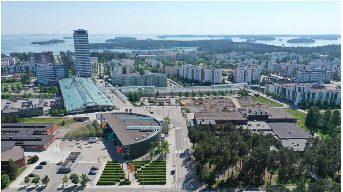
Kuva 1. Mosaiikkikortteli sijaitsee aivan Vuosaaren keskustassa.

Suunnittelualueella sijaitsee tällä hetkellä pysäköintikäytössä oleva rakentamaton liike- ja toimis- totontti sekä urheilutoimintaan tarkoitettu tontti. Naapuritontille valmistuu syksyllä 2021 Vuosaa- ren uusi lukio.