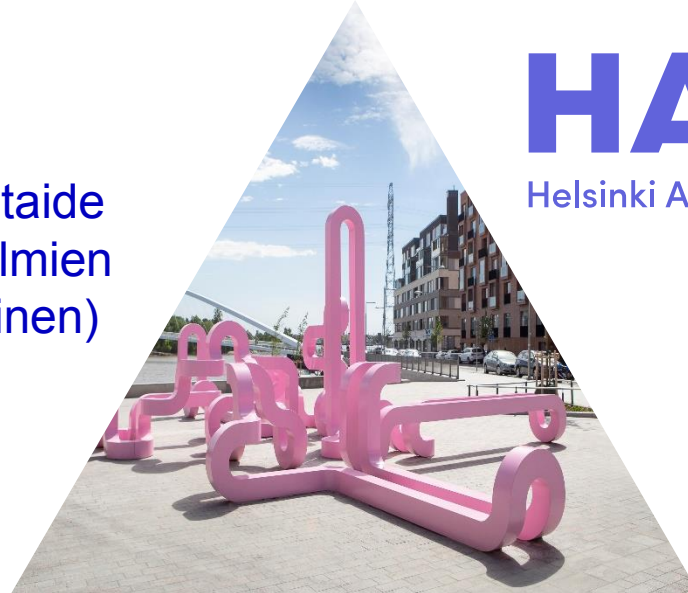
Julkinen taide (ja kokoelmien sijoittaminen)