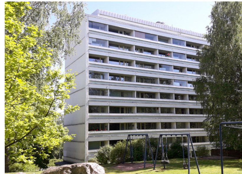
Itäkeskuksen ja sen ympäristön rakennusinventointi 8/2020