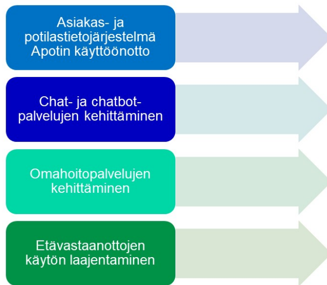
Kuvio 3. Digitaalisten ratkaisujen kehittäminen

Hyödynnämme tiedolla johtamisessa entistä aktiivisemmin ja systemaattisemmin saatavilla olevia aineistoja sekä Apotti-järjestelmän tuomia uusia mahdollisuuksia. Muutosvaiheessa huolehdimme myös Apotin myötä poistuvien järjestelmien tietovarantojen tallennuksesta.