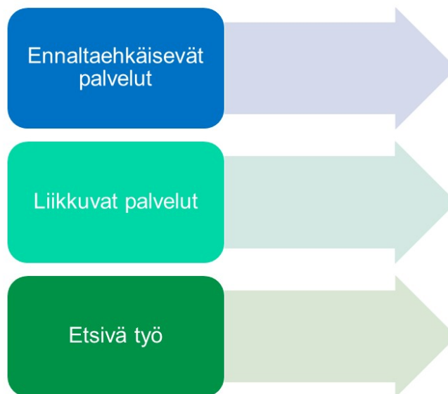
Kuvio 4. Ennaltaehkäisevien, liikkuvien ja matalan kynnyksen palvelujen kehittäminen

Lisäämme ennaltaehkäiseviä, liikkuvia ja matalan kynnyksen palveluja. Kuviossa 3. esitetään tämän tavoitteen osa-alueet.