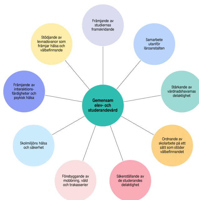
Figur 3. Exempel på innehållet i den gemensamma elev- och studerandevårdens verksamhet

Gemensam elev- och studerandevård som främjar välbefinnande är inriktad på hela lärgemenskapen. Arbetet kan också riktas till specifika grupper eller tidpunkter så som förskoleundervisningens eller grundskolans start- och slutsked. I figur 3 presenteras exempel på verksamhetsinnehållet i den gemensamma elev- och studerandevården.