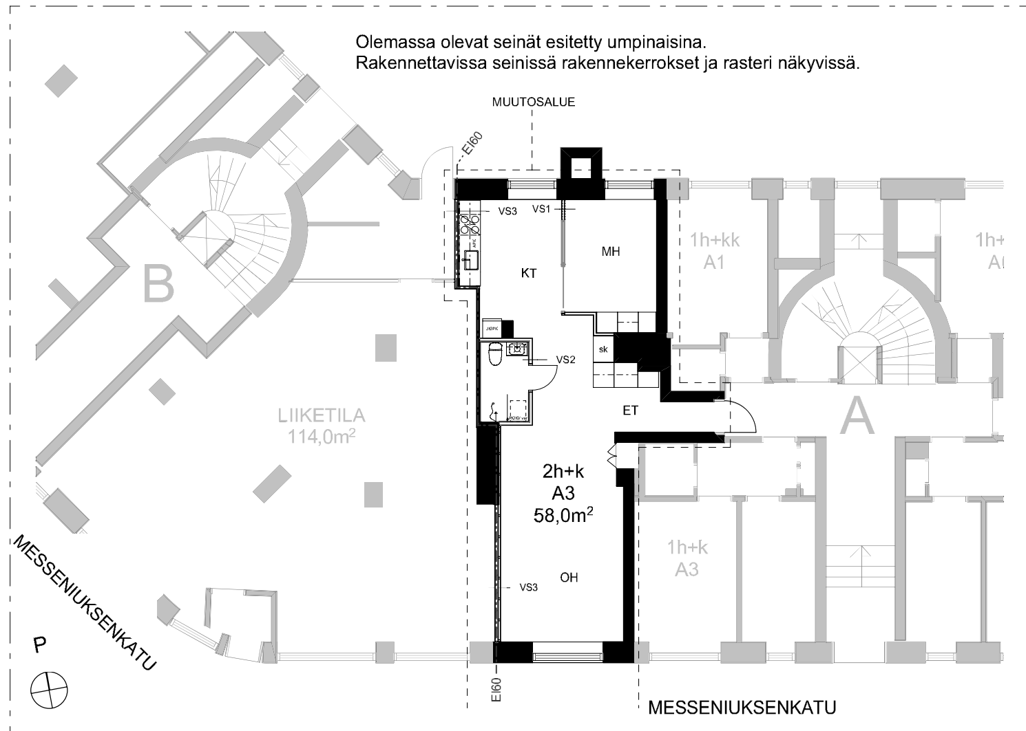
POHJAPIIRROS MUUTOKSEN JÄLKEEN, 1. krs, 1:150