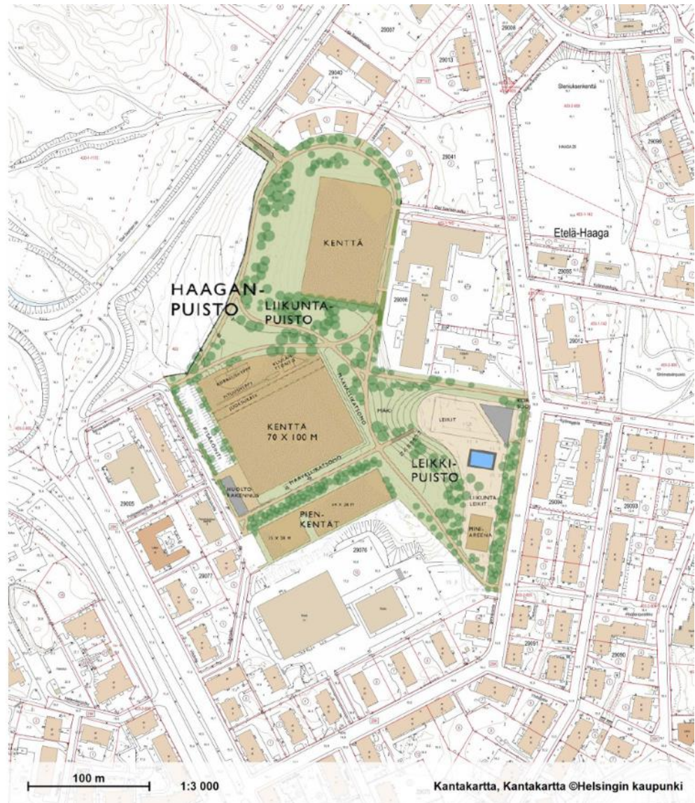
Ote Haaganpuiston yleissuunnitelmasta vuodelta 2009.

Haaganpuiston alaosiion jätetyissä kommentteissa nousi esiin erityisesti asukkaiden ja alueen käyttäjien halu ja toive säilyttää alue vihreänä puistoalueena, jonne voi mennä kävelemään, ulkoiluttamaan koiraa, nauttimaan luonnosta tai kokoontua viettämään aikaa esimerkiksi piknikin merkeissä tai pelaamaan frisbeegolfia. Puisto koetaan tärkeänä viher- ja virkistysalueena koko Etelä-Haagan mittapuulla ja se toivottiin säilyvän sellaisenaan jatkossakin.