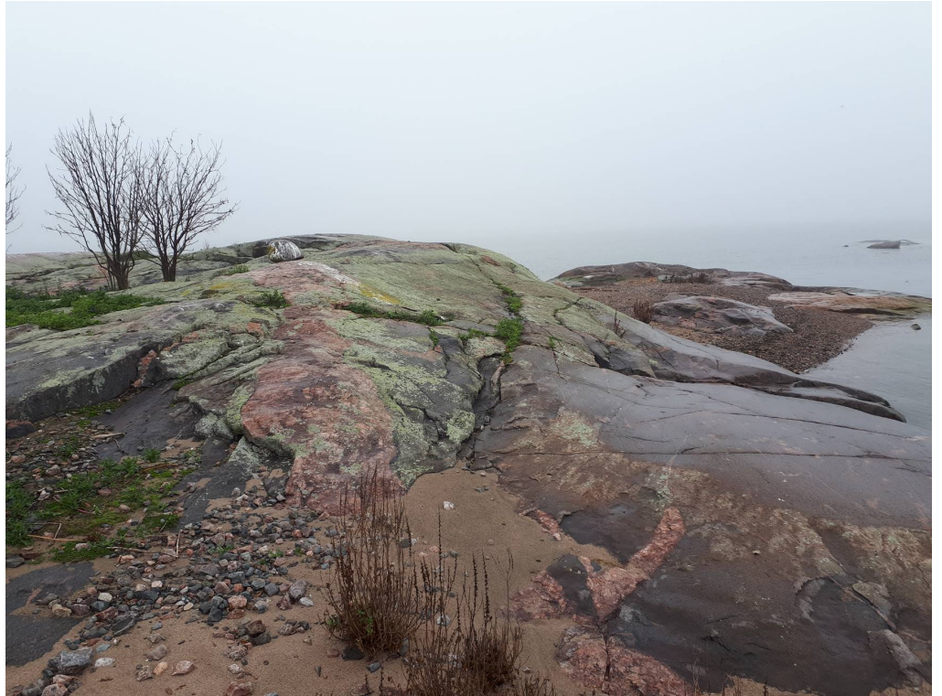
Kuva 1. Näkymä itäisemmältä isolta luodolta pohjoiseen.