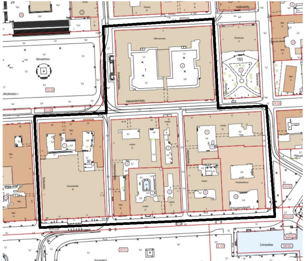
Kuva 1. Tiedotusalue rajattu mustalla viivalla (Määräys 5).