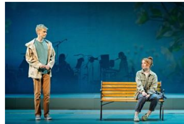
Helsingin kaupunginteatteri, Rakas Evan Hansen