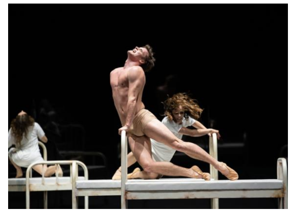
Baletti Jekyll & Hyde