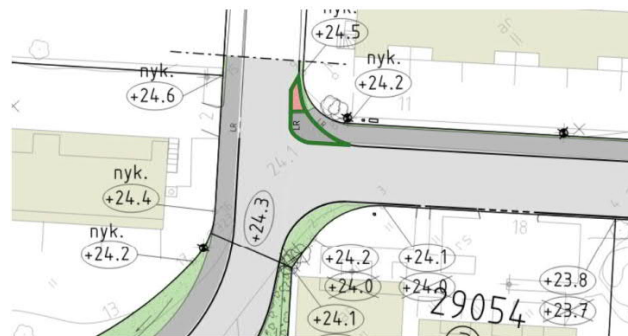
Kuvankäsittellyllä muokattu suunnitelma: näin jalankulkijan ylitysmatka olisi nykyistä lyhyempi.

Kun Orapihlajatien ja Orapihlajakujan risteysaluetta verrataan muihin asuntokatuja risteyskohtiin, joita nähtävillä olevissa Etelä-Haagan katusuunnitelmissa esitetään, voidaan todeta Orapihlajakujan liittymässä olevan avarat kaarteet, jotka mahdollistavat verrattain suuria nopeuksia. Lisäksi Orapihlajatien suuntaisesti kävelevä jalankulkija ylittää Orapihlajakujan kohdassa, jossa ei ole suojatietä. Jalankulkijan tienylytyskohdassa ajorataa tulisi kaventaa (kuva), jotta kadun ylittäminen olisi sujuvaa ja turvallisen tuntuista. Orapihlajakujan haaran kaarresäteen tulee olla pieni, sillä kaakosta koilliseen kääntyvän ajoneuvoliikenteen täytyy väistää Orapihlajakujaa ylittäviä jalankulkijoita, mikä perustelee kääntyvien autoilijoiden nopeuksien hillintää tiukalla risteysgeometrialla.