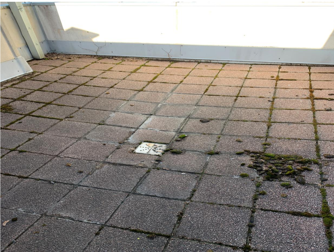
saunaosaston parveke. Kasvillisuutta puskee laattojen ja saumojen välistä.