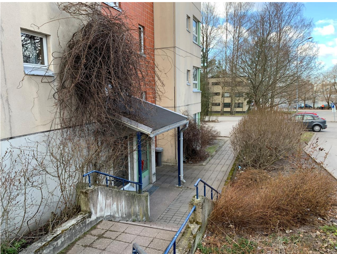
rakenteet kasvillisuuden peitossa.