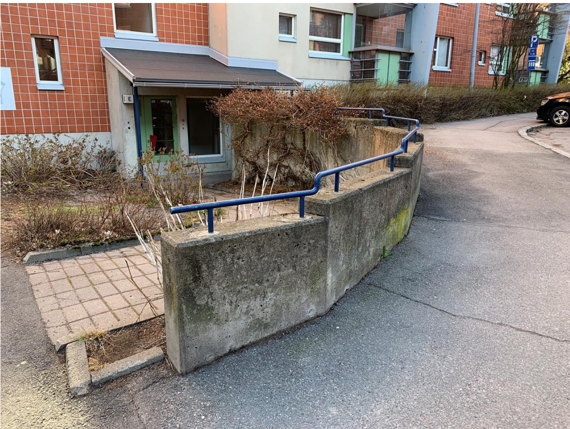
kasvillisuutta E rapun edessä.