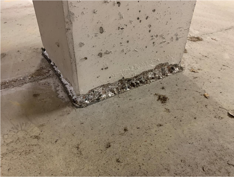
parkkihallin pilarin juuri.