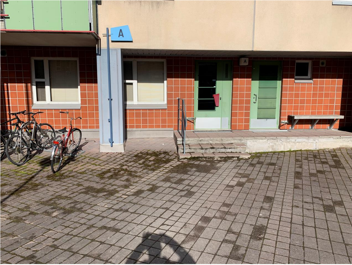
A rapun portaiden edusta hunossa kunnossa.