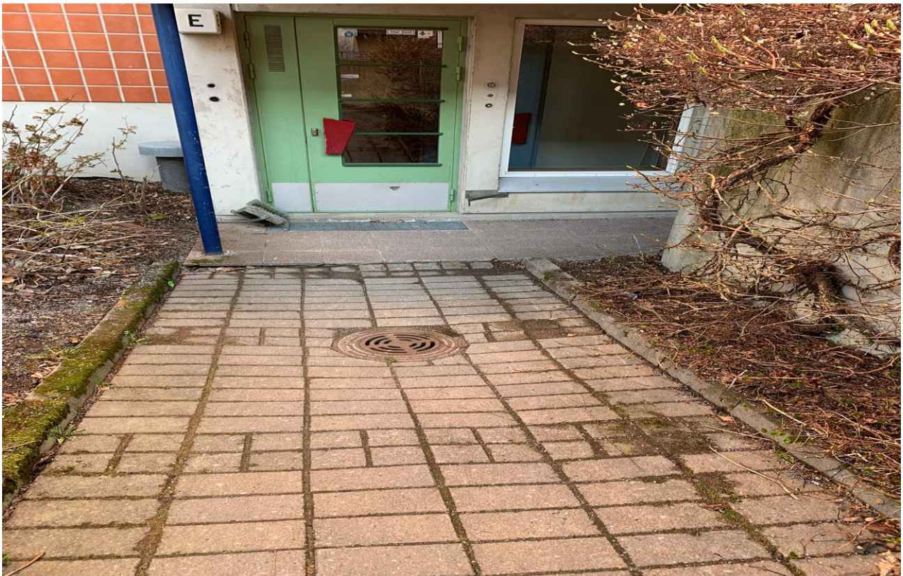
Kaivo ylämäessä, vesi valuu sokkeliin ja rapun eteen.