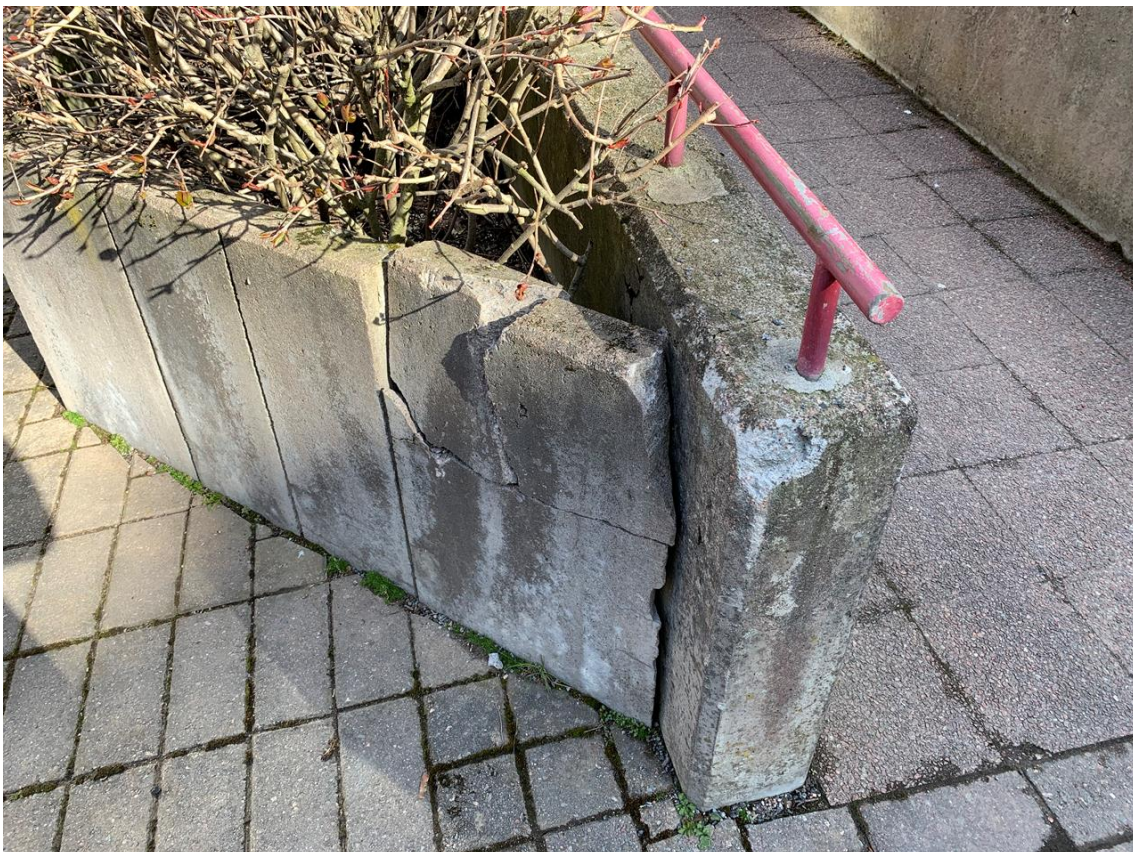
sisäpihan tukimuuri rikki.