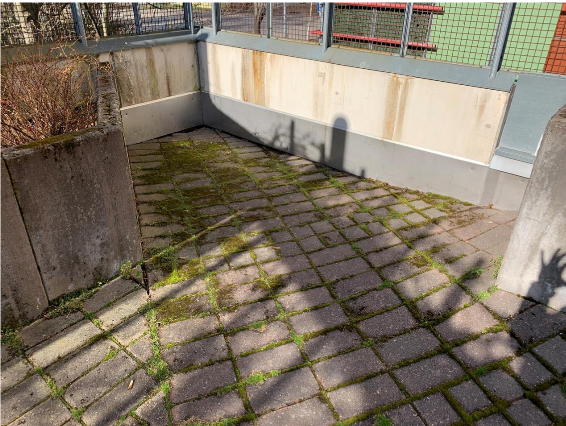
Sisäpiha kaadot rakenteisiin päin.