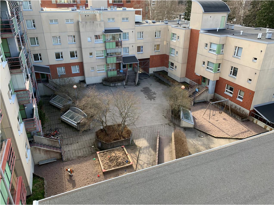
yleiskuva toiselta puolelta pihaa.