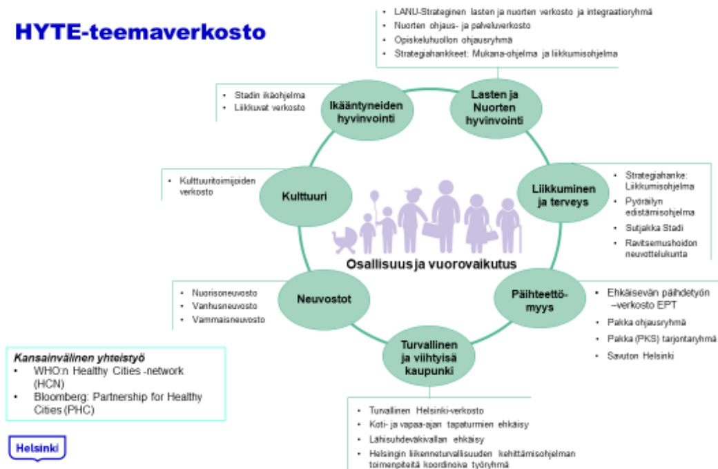
Kuva 4. Hyvinvoinnin ja terveyden edistämisen verkostot Helsingissä