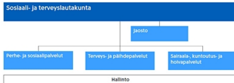
Kuva 2. Sosiaali- ja terveystoimen organisaatio 1.6.2017 lähtien

Äitiys- ja lastenneuvolan, sekä koulu- ja opiskeluterveydenhuollon lääkärit ovat keskitetty Lasten ja nuorten lääkäripalveluiden alayksikköön. Alayksikkö on Terveys- ja päihde palvelukokonaisuuden Terveysasemat ja sisätautien poliklinikan palveluiden Keskitettyjen palveluissa. Opiskeluiden sairaanhoito taas kuuluu alueellisille terveysasemille.