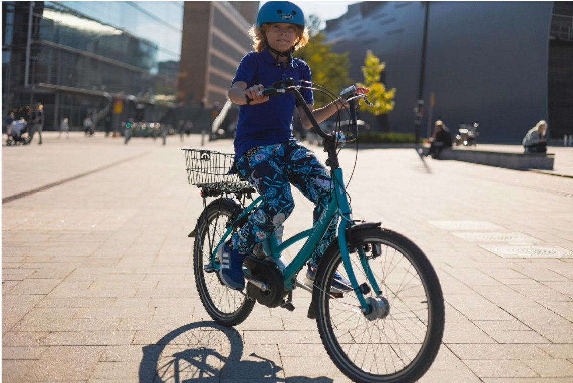
Kuva 4. ILME-suunnitelman asukasvuorovaikutusta ja viestintää toteutettiin muun muassa Auton vapaapäivän tapahtumassa, jossa kaupunkilaisilla oli esimerkiksi mahdollisuus testata erilaisia polkupyöriä.

Helsingin kaupungin ympäristönsuojelu ja ohjaus -yksikkö kiittää kaikista saaduista mielipiteistä. Niissä esiin nostetut asiat huomioidaan suunnitelman viimeistelyssä. Mielipiteissä esitettiin monia huomioita, jotka vahvistavat ILME-suunnitelmassa esitettyjen toimenpiteiden tärkeyttä. Kaikki mielipiteissä esitetyt asiat eivät kuitenkaan ole ILME-suunnitelmassa toteutettavia, joten ne on välitetty niistä vastaaville tahoille.