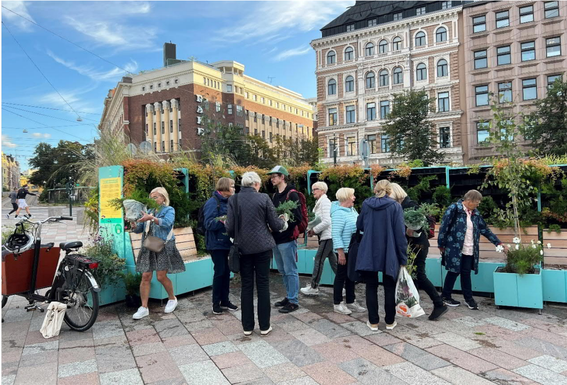
Kuva 3. Kuva vehreiden meluseinäkkeiden päätöstilaisuudesta, jossa seinäkkeiden kasvit jaettiin kaupunkilaisille.