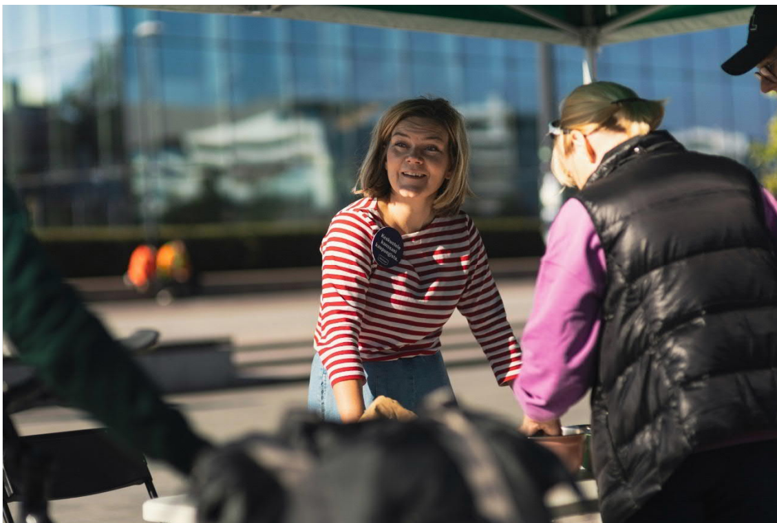
Kuva 2. Ympäristöpalveluiden ilmansuojelun ja meluntorjunnan asiantuntijat olivat tavattavissa Auton vapaapäivän tapahtumassa syyskuussa 2023.

ILME-suunnitelmaa valmistelevat ilmansuojelun ja meluntorjunnan asiantuntijat olivat tavattavissa Euroopan liikkujan viikolla syyskuussa 2023 järjestetyssä Auton vapaapäivän tapahtumassa Helsingin Kansalaistorilla. Tapahtumassa asiantuntijat kertoivat valmisteilla olevasta suunnitelmasta sekä keskustelivat asukkaiden kanssa kaupungin ilmanlaatuun ja meluun liittyvistä asioista. Pisteellä kävi keskustelemassa noin 30 kaupunkilaista, ja koko tapahtumassa kävijöitä oli arviolta useita satoja. Myös käynnissä ollut tietovisaa mainostettiin Auton vapaapäivän tapahtumassa.