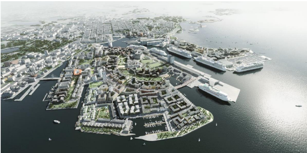
Jätkäsaaren visualisointi, Tietoa