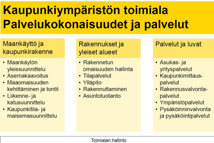
Kuvio 1. Kaupunkiympäristön toimialan palvelukokonaisuudet

Kaupunkiympäristön toimialan rakennukset ja yleiset alueet -osaston (RYA) tehtäviin kuuluvat rakennetun omaisuuden hallinta, tilapalvelut, ylläpito, rakennuttaminen ja asuntotuotanto. Tämä osasto on kaupungilla keskeisessä roolissa suhteessa rakentamispalveluliikelaitos Staraan.