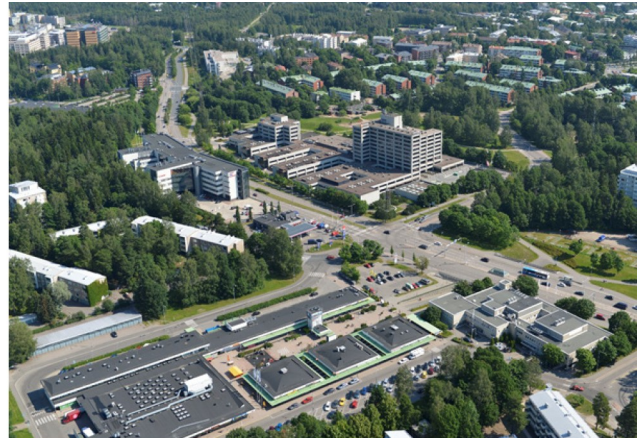
Munkkivuoren ostoskeskuksen alue.

Talin liikunta- ja ulkoilupuiston alue Huopalahdentien yhteydessä ulottuu Ulvilantien pohjoispuolelta Vanhalle Viertotielle. Huopalahdentien varteen sijoittuvien alueiden täydennysrakentamisen mahdollisuuksia Canon:n toimistotalon ympäristössä tutkitaan. Lisäksi selvitetään liikuntahallien nykyisin paljon tilaa vievien pysäköintialueiden uudelleen järjestelyn edellytyksiä sekä mitä uusia toimintoja tälle alueelle olisi mahdollista sijoittaa. Tarkoituksena on myös vahvistaa virkistys- ja viheryhteyttä Talin ulkoilupuiston ja Korppaanpuiston välillä.