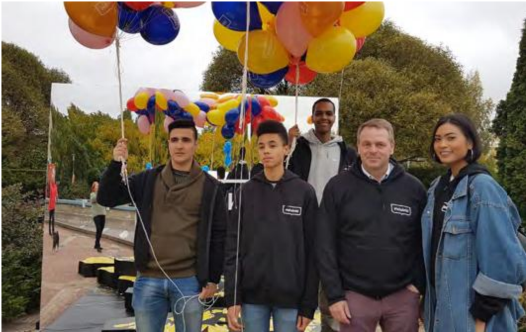
Pormestari Jan Vapaavuori Malmin Lähiöfest2017-tapahtumatorilla 30.9.2017

Helsingin kaupunki avasi omalta osaltaan viikonloppuna neljä ns. tapahtumatoria, jotka toimivat kaikille avoimina kohtaamispaikkoina. Torit olivat yhdistelmä sisä- ja ulkotiloja ja ne järjestettiin Vuosaarissa, Malmilla, Pohjois-Haagassa ja Herttoniemenrannassa. Tapahtumatorien tuotannosta vastasi Lähiöprojekti.