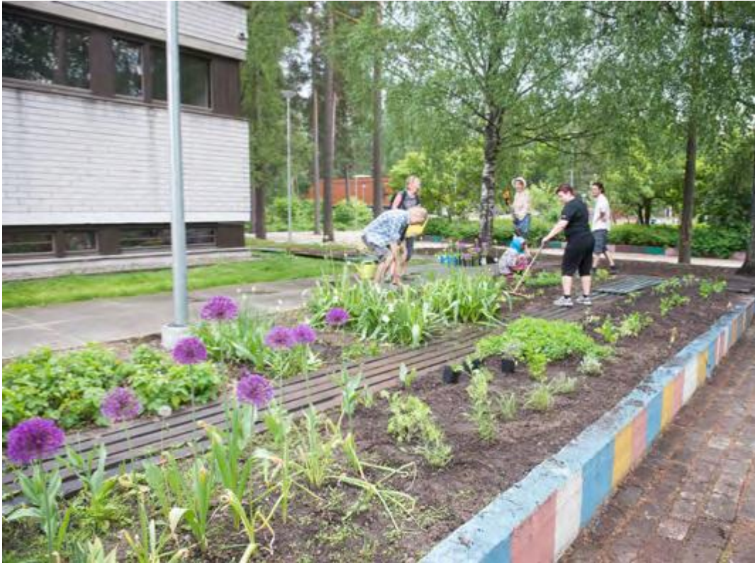
Lähiöpuutarhan toimintaa Jakomäessä