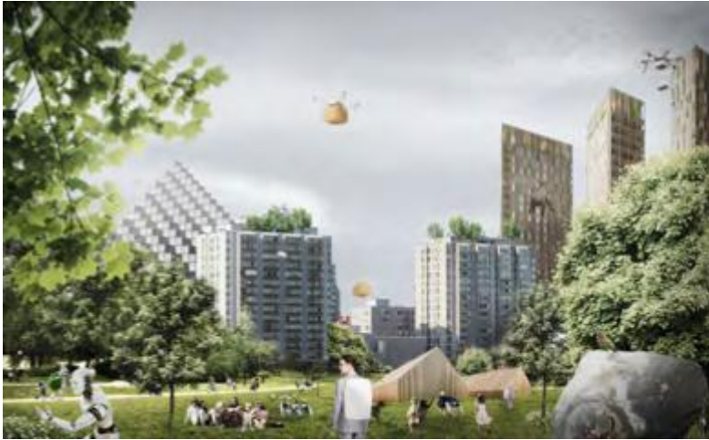
Kuva Arkkitehtitoimisto MUUAN