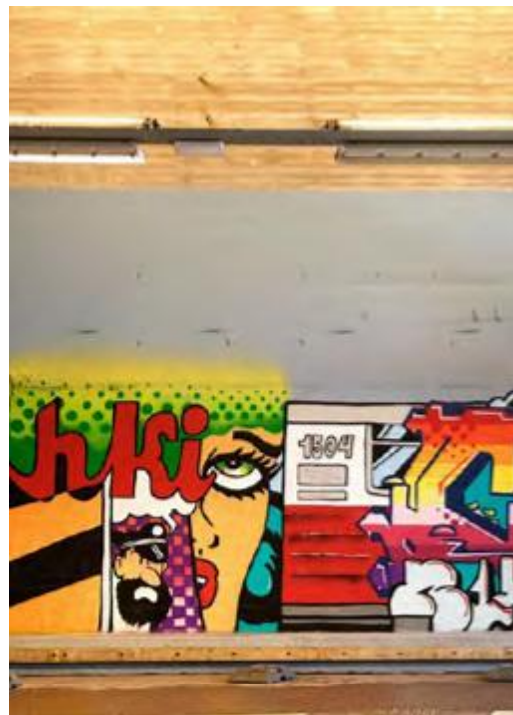
Malminkartanon juna-aseman tunnelin maalauksia,