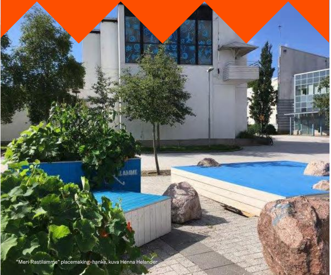
"Meri-Rastilamme" placemaking-hanke, kuva Henna Helander