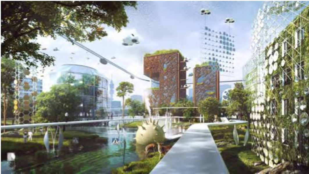
Kuva Arkkitehtitoimisto Kaleidoscope