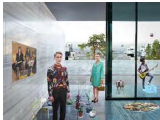
Kuva JADA Architects

Lähiö vuonna 2100 -video (5 min) sekä videon teaser (1 min) ja Tulevaisuusvisiot ja niiden esittelytekstit löytyvät aineistopankista ( http://aineistopankki.hel.fi )