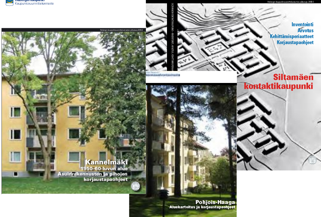
Kannelmäen, Pohjois-Haagan ja Siltamäen korjaustapaohjeet