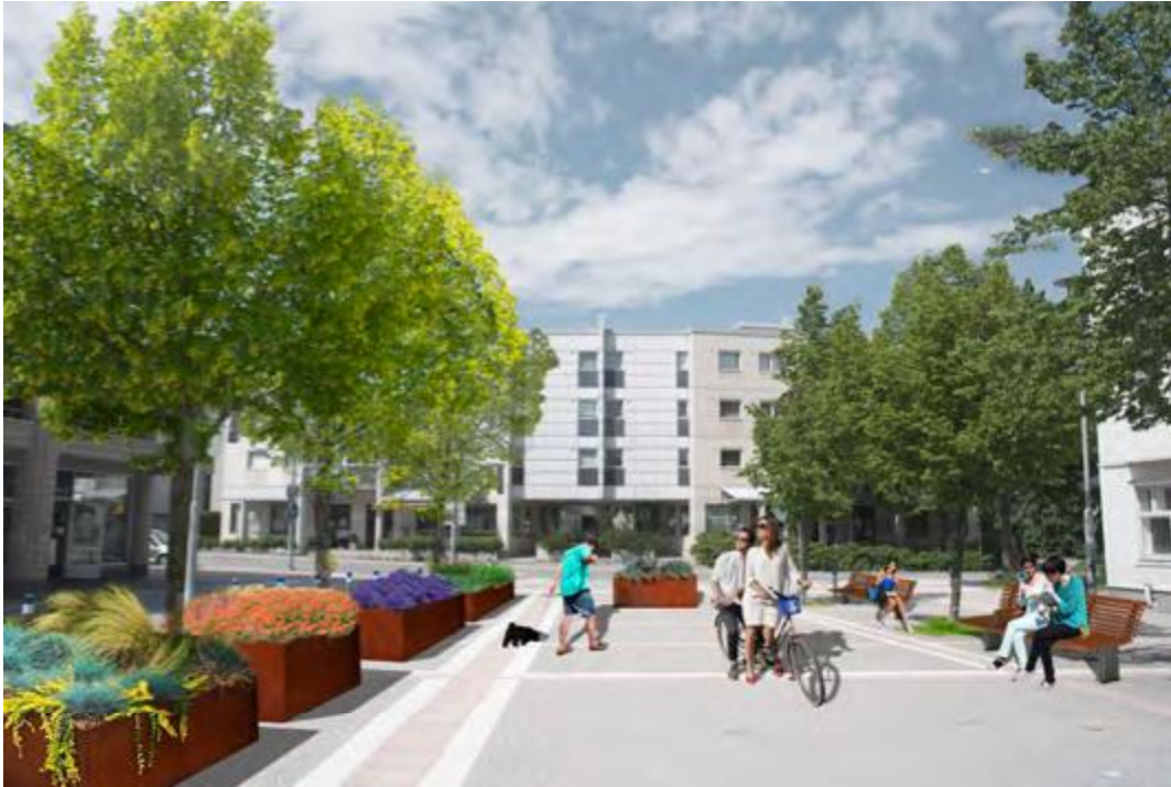
Ylä-Malmin torin ideasuunnitelma, kuva Olga Juutistenaho

Hanke: Ylä-Malmin torin ja Kaupparaitin ideasuunnittelu