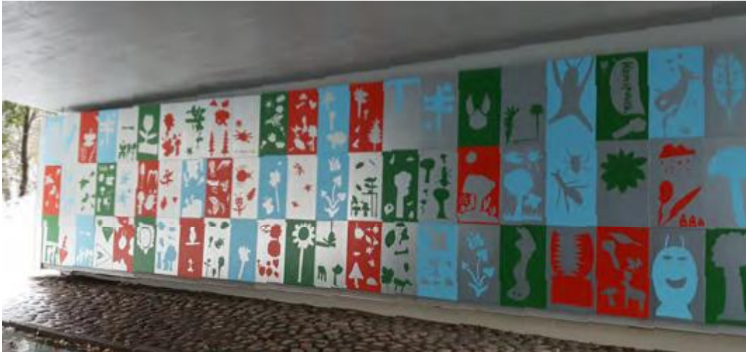
Jakomäen Broda2-taideseinä, kuva Pirjo Ruotsalainen