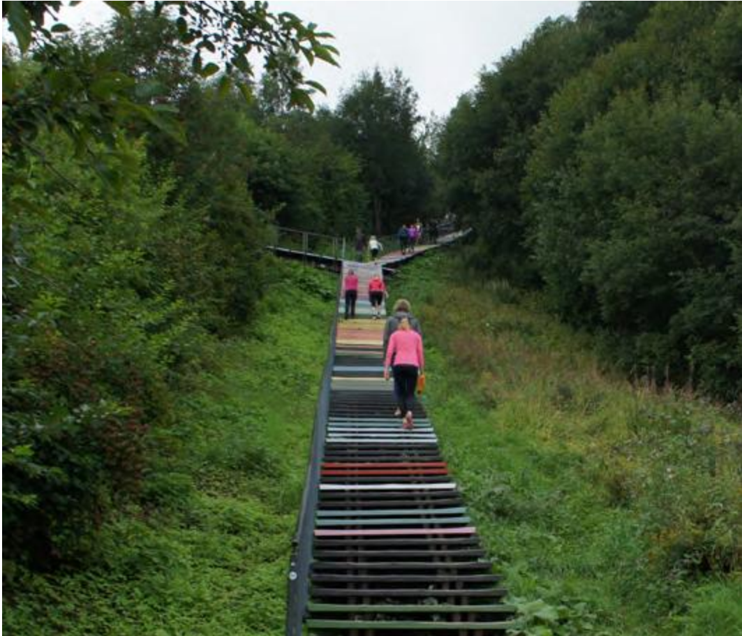
Malminkartanonhuipun portaat

Toiminta: Asukastoiminnan hankkeet sosiaali- ja terveystoimen kanssa