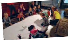
Lähio festin kassan elämästä on myös kassan elämästä, jossa on kassan elämästä ja kassan elämästä.

Lähio festin kassan elämästä on myös projektiin ohjelmaa, jota on myös kassan elämästä. Paikalla on viikonloppuun ohjelmaa, jota on myös kassan elämästä. Kiertävissä kahveissa on myös kassan elämästä.