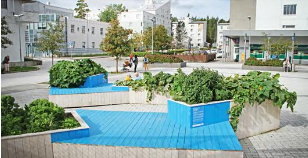
Meri-Rastila, kuva Jalmari Sarla