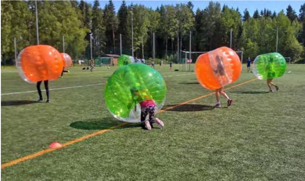
Lajikokeilussa kuplafutis