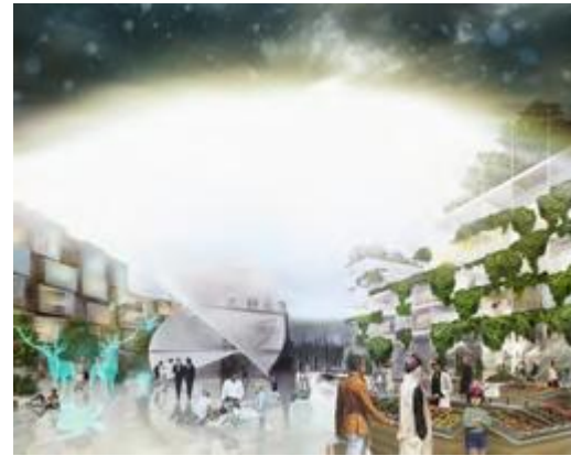
Kuva Virkkala de Vocht Architects