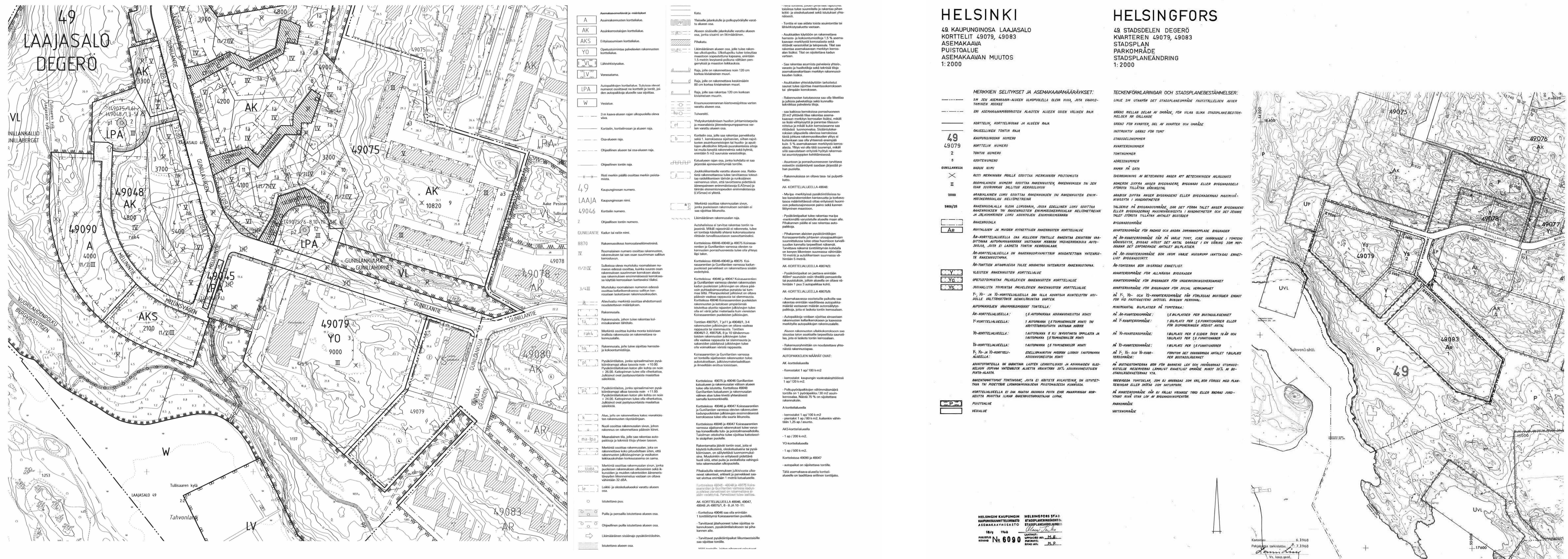
Asemakaava 11888, 25.5.2012