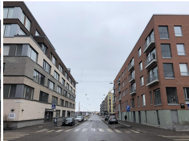
Junonkatu 10-14 / Junonkatu 9