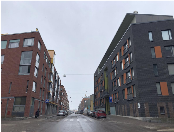
Antareksenkatu 3 / Junonkatu 4

Tiedotukseen varmistuu tarkat osoitteet ja mukaan lähtevät kohteet.