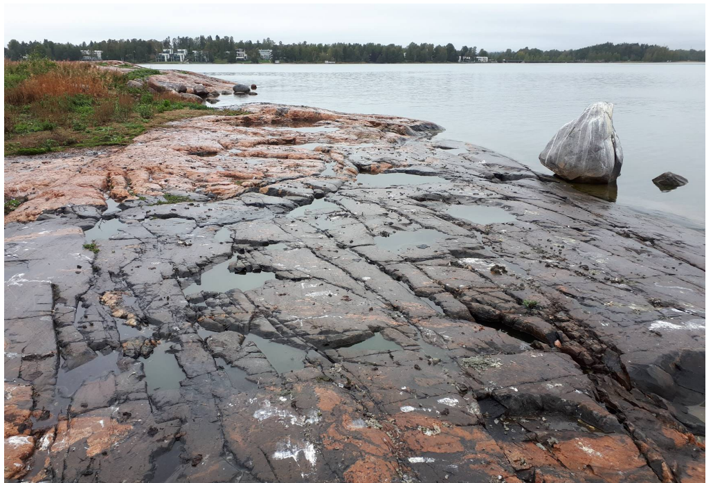
Kuva 1. Näkymä Morsianluodon itärannalta pohjoiseen.

Elinkeino-, liikenne- ja ympäristökeskus voi yksittäistapauksessa myöntää poikkeuksen luonnonsuojelualueita koskevista rauhoitusmääräyksistä, jos poikkeaminen ei vaaranna alueen perustamistarkoitusta ja on tarpeen alueen hoidon, käytön tai tutkimuksen kannalta.