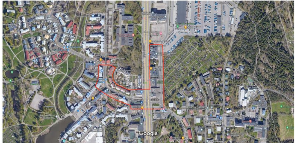
Kuva 2. Ilmoituksen karttaliite