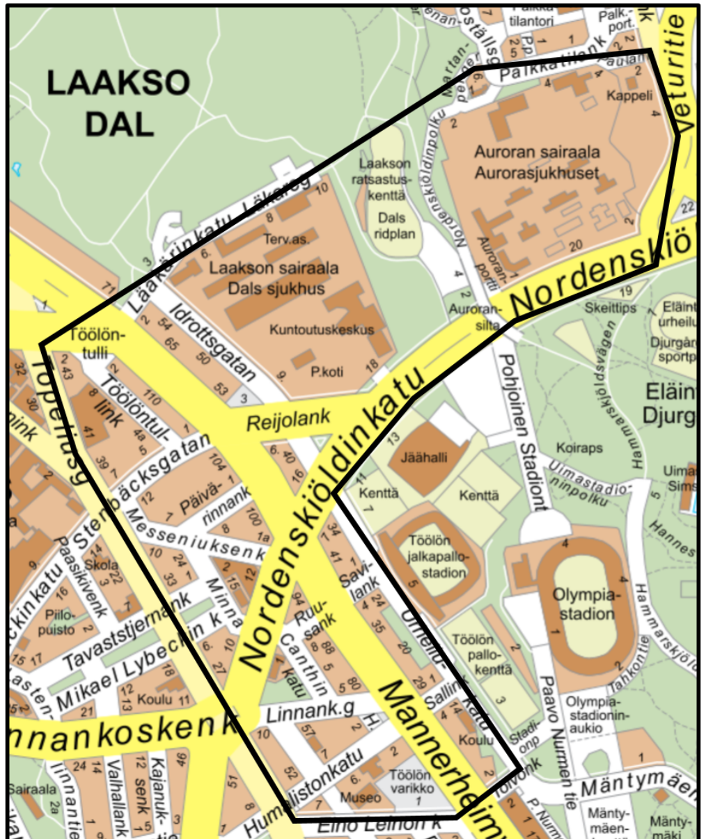
Kuva 1. Tiedotusalue rajattu mustalla viivalla (Määräys 6).