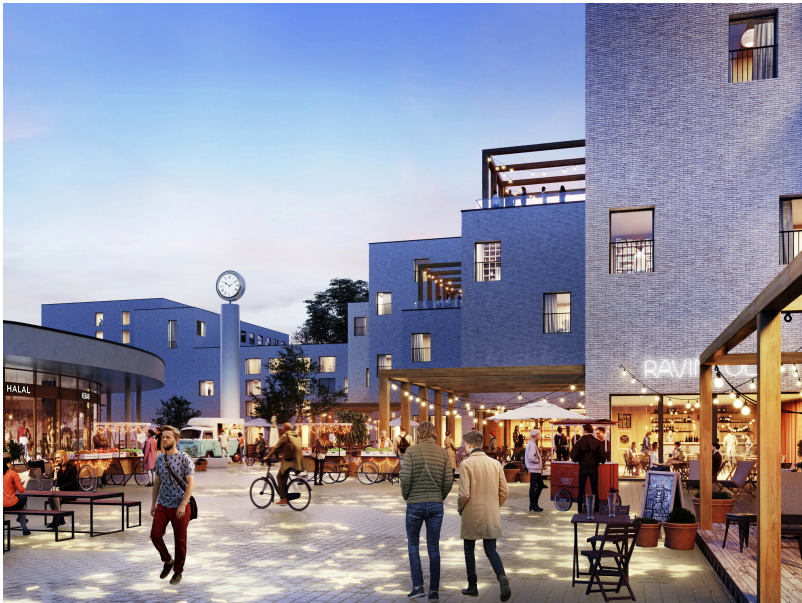
Kuvat ITIS SITI kilpailuehdotus

Puotinharjun Puhos Oy on laatinut alueelleen kehityssuunnitelman vuosille 2019- 2030.