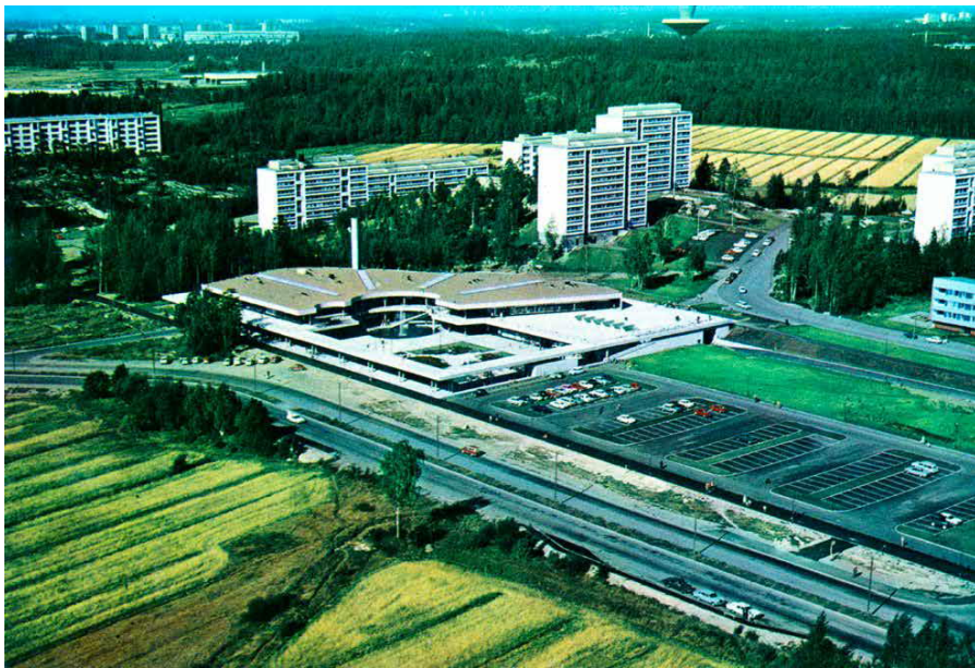
Ilmakuva Puotiharjun puhoksesta 1960-ltai 1970-luvulla.