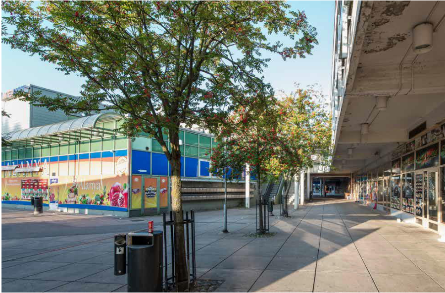
Verrantokuvia kuvattuna samasta kohdasta vuonna 2019. C-osa sijoittuu pihan keskelle ja sisäpihti on muutettu parkkipaikaksi.