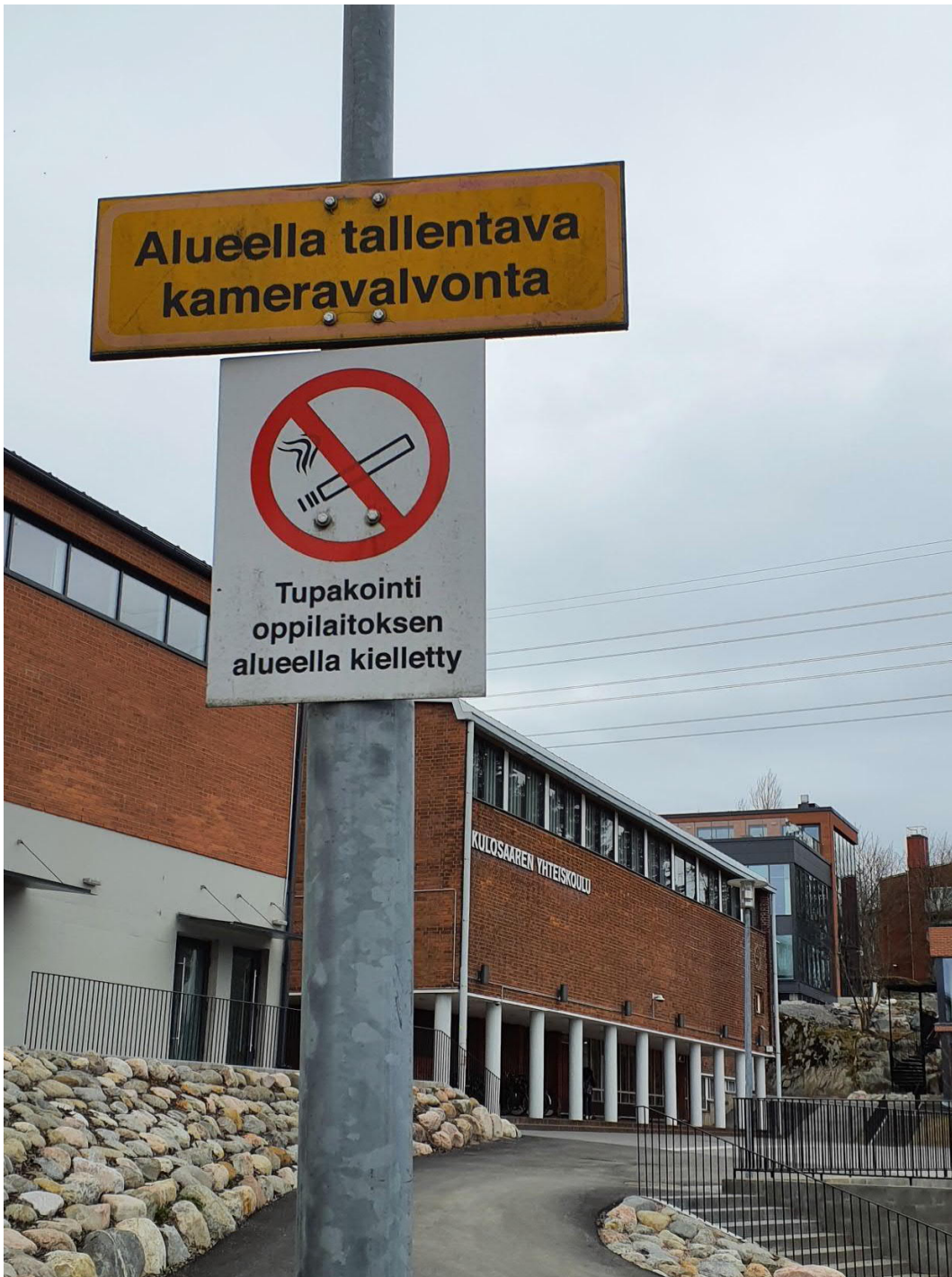
Tupakkalain vaatimusten mukainen kieltomerkki koulun pihalla.