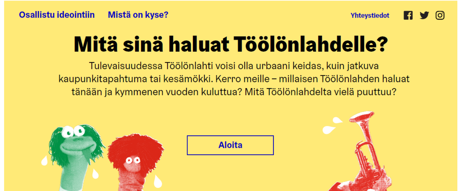
Töölönlahden ideointi- ja kyselyalustan etusivun layout.

Kyselyn tueksi toteutettiin laaja markkinointikampanja kärjellä ”Mitä sinä haluat Töölönlahdelle?”