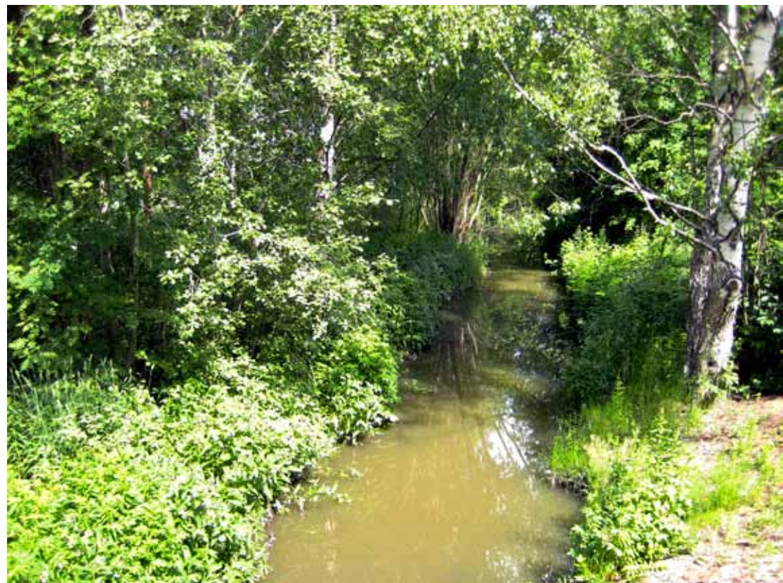
■ Longinojan varrella kasvava rehevä lehtisekametsä on letoa ja arvometsää.

Arvometsiä hoidetaan alue- ja luonnonhoitosuunnitelmissa kuvattujen erityisohjeiden mukaisesti. Luonnonsuojelullisesti arvokkaat alueet, joiden luontoarvot säilyvät tai paranevat sillä, että niille ei tehdä mitään, jätetään hoidon ulkopuolelle. Hoidon ulkopuolelle jättämisestä on aina erillinen maininta suunnitelmissa.