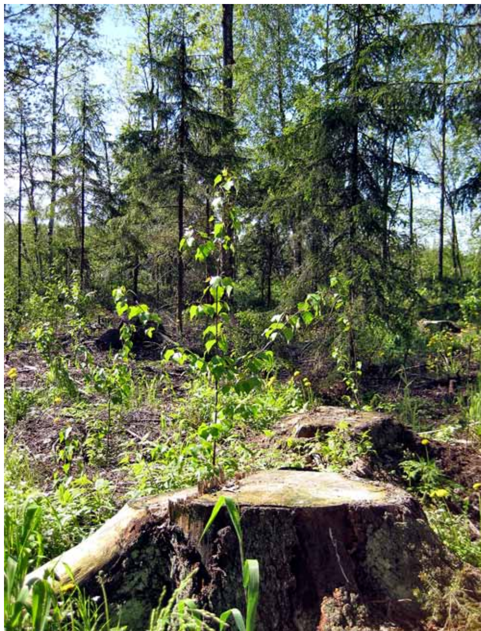
■ Uudistettuun pienaukkoon voidaan istuttaa myös valoa vaativia koivuja.