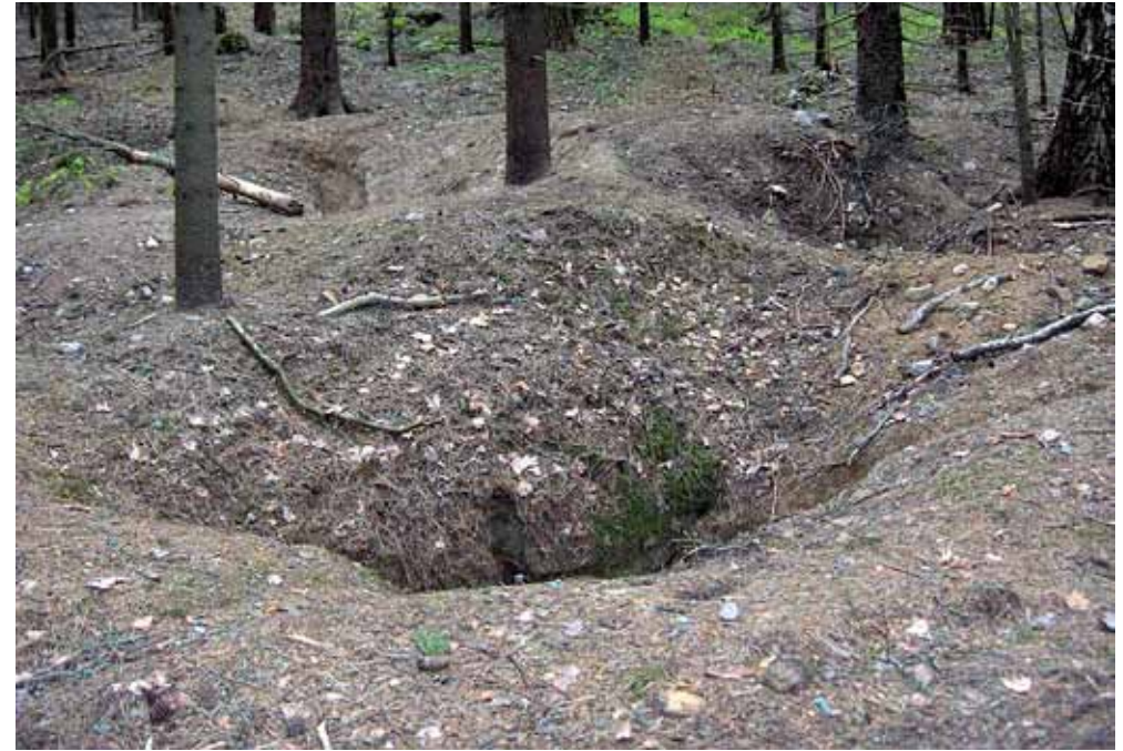
■ Mäyrän pesäluolasto on suojeltu kohde.