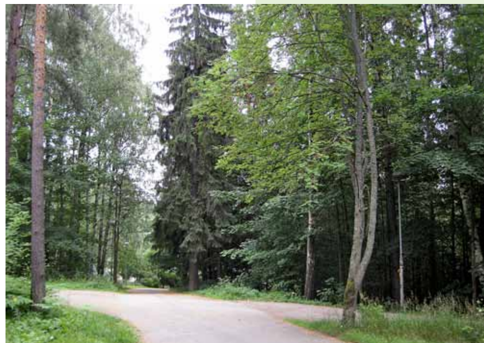
■ Ulkoilureittien risteyskohtien näkymät pidetään avoimina.