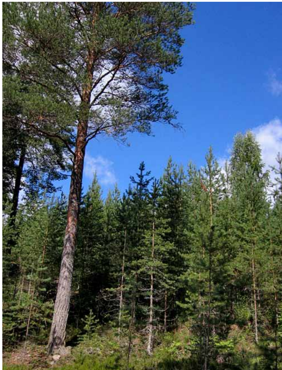
■ Karummat puolukkatyyppin kangasmetsät uudistuvat hyvin luontaisesti männylle.

Metsää voidaan uudistaa sopivissa olosuhteissa myös vaihteittain jatkuvan uudistumisen kautta, jolloin varsinaista taimikkovaihetta ei ole, vaan metsässä on jatkuvasti eri-ikäisiä puita. Tästä asiasta esitetään lisää luvussa 5.6.