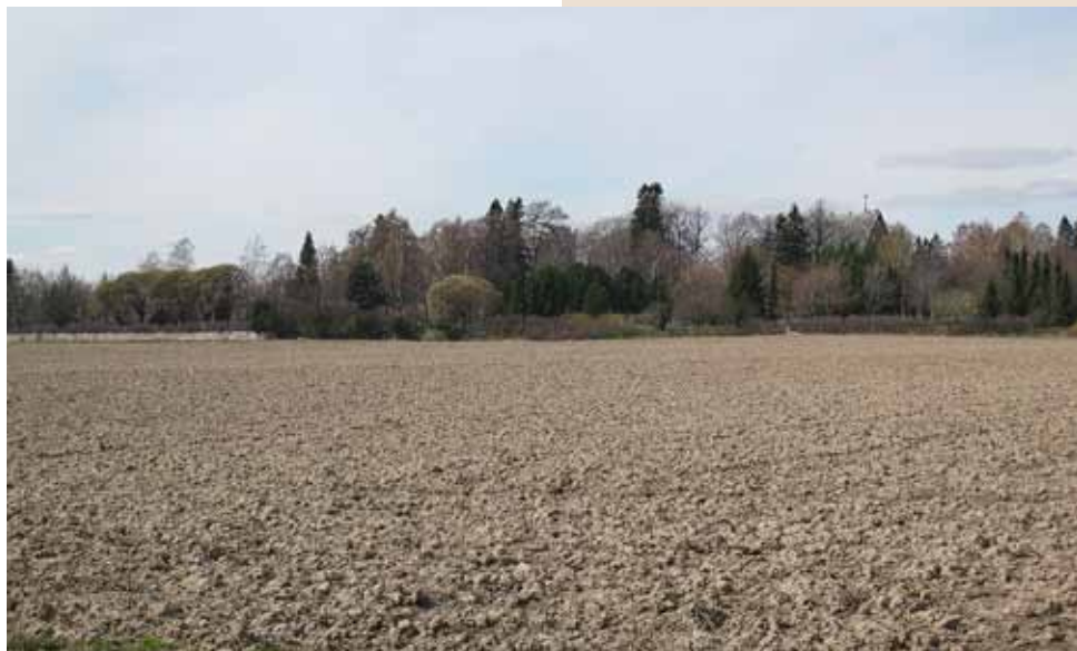
■ Pyhän Laurin kirkko on peittynyt puuston sisään.