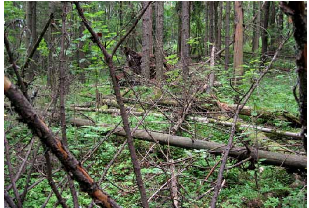
■ Haltialan aarnialueen luonnonsuojelualueella on runsaasti lahoppuuta.

tys- ja ulkoilualueelle paremmin sopivaksi.