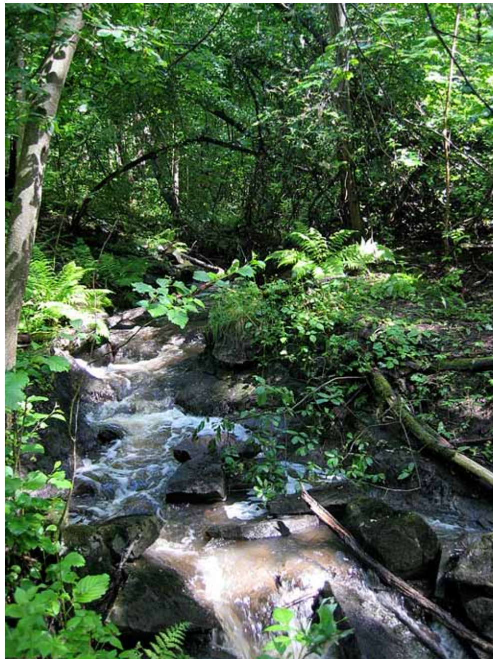
■ Purot kuuluvat metsäluonnon arvokohteisiin kuten tämä Viikinojan puro.