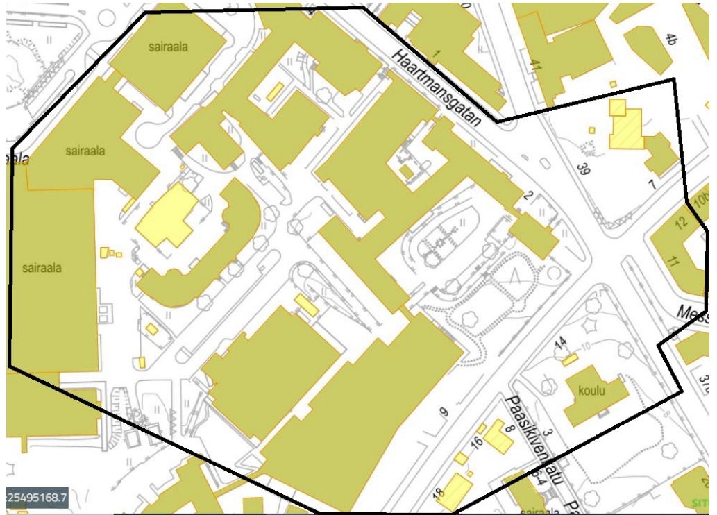
Kuva 1. Tiedotusalue rajattu mustalla viivalla (Määräys 4).