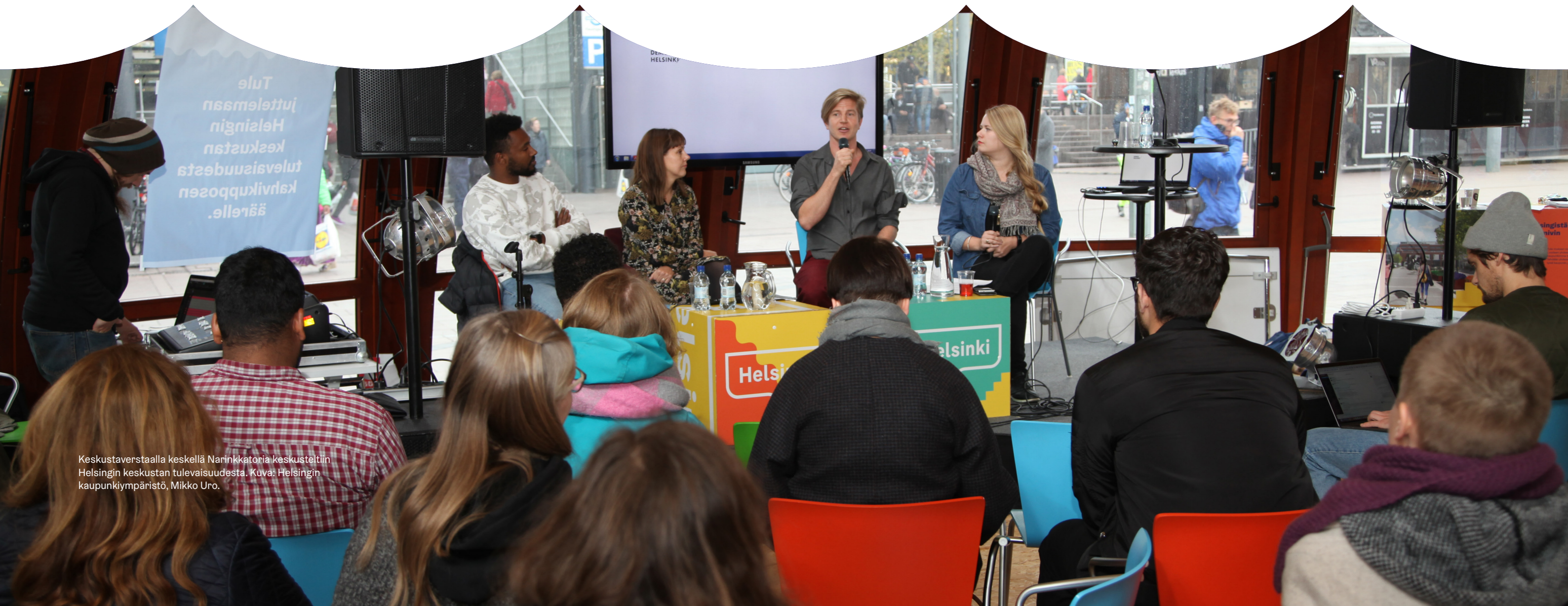
Keskustaverstaalla keskellä Narinkkatoria keskusteltiin Helsingin keskustan tulevaisuudesta.

12. Kaikilla pitäisi olla syy, mutta myös varaa tulla keskustaan. Julkisen liikenteen hinnoitteluun, palveluihin, tapahtumiin ja yöelämään; kaupungin magneetteihin tulisi kiinnittää huomioita.