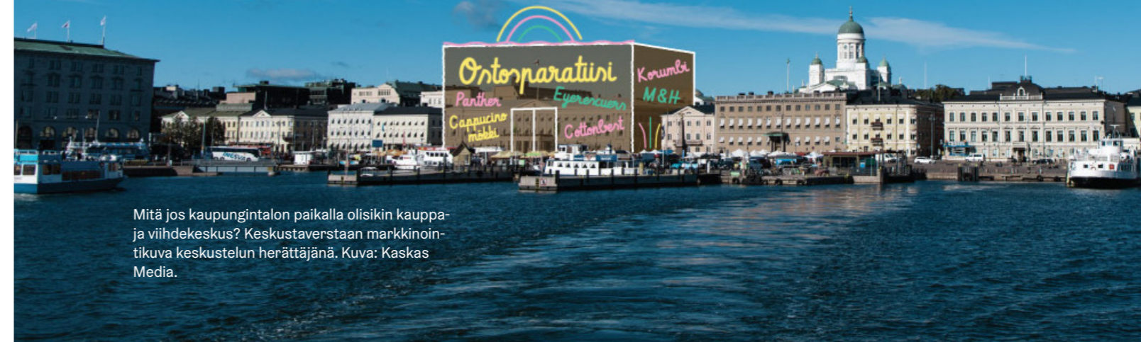
Mitä jos kaupungintalon paikalla olisikin kauppa- ja viihdekeskus? Keskustaverstaan markkinointikuva keskustelun herättäjänä.