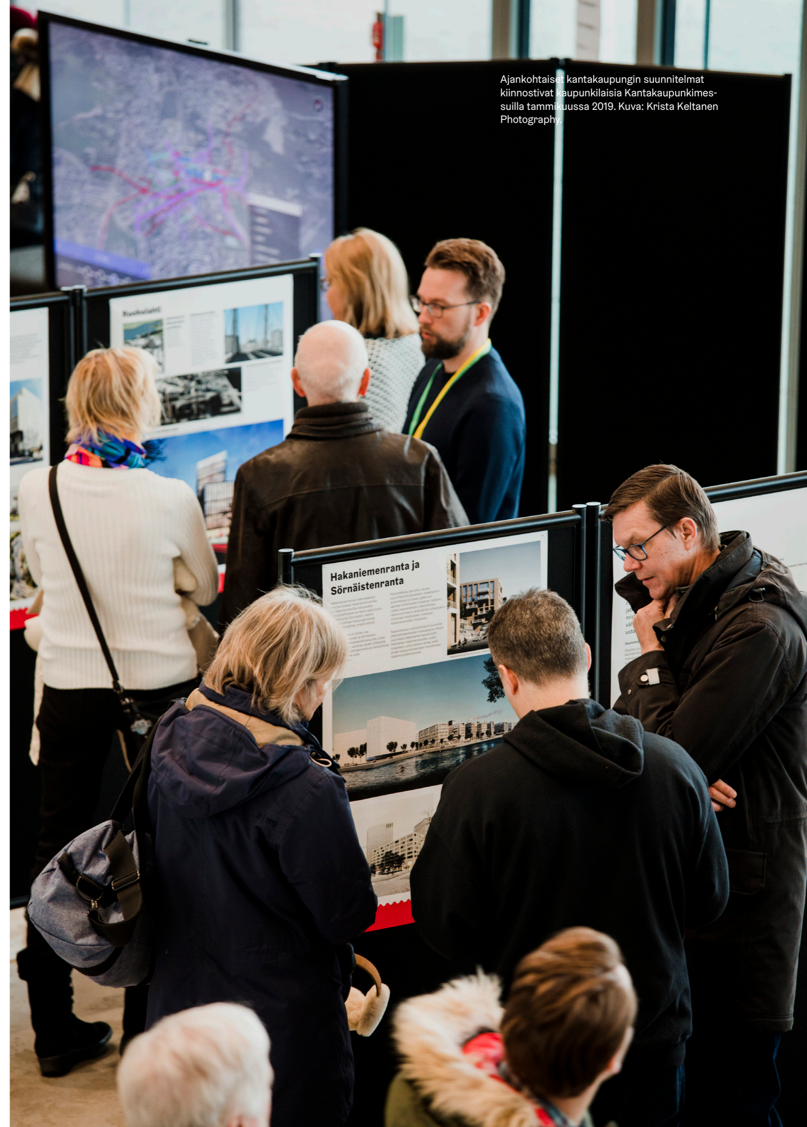
Ajankohtaiset kantakaupungin suunnitelmat kiinnostivat kaupunkilaisia Kantakaupunkimessuilla tammikuussa 2019.