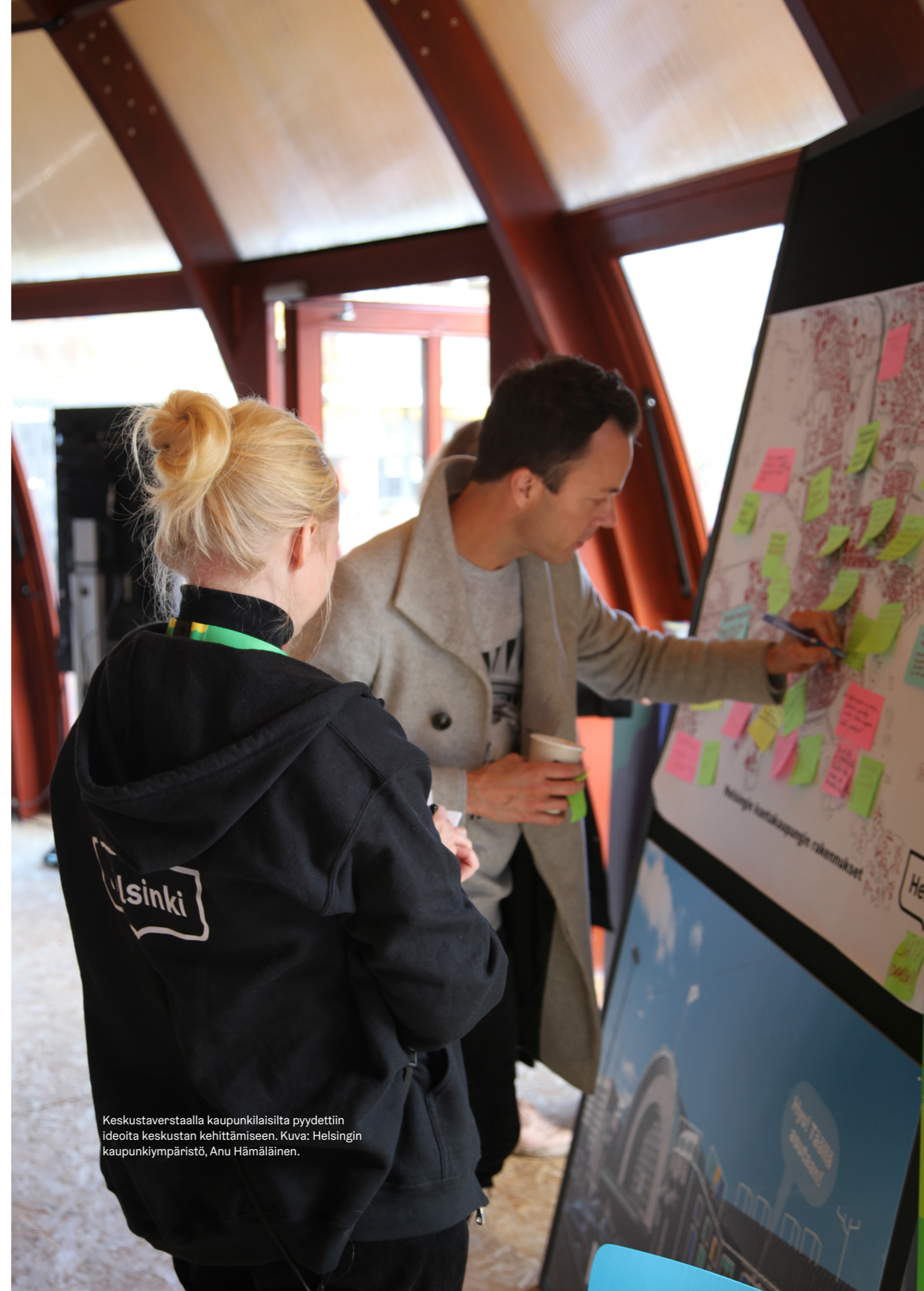
Keskustaverstaalla kaupunkilaisilta pyydettiin ideoita keskustan kehittämiseen.