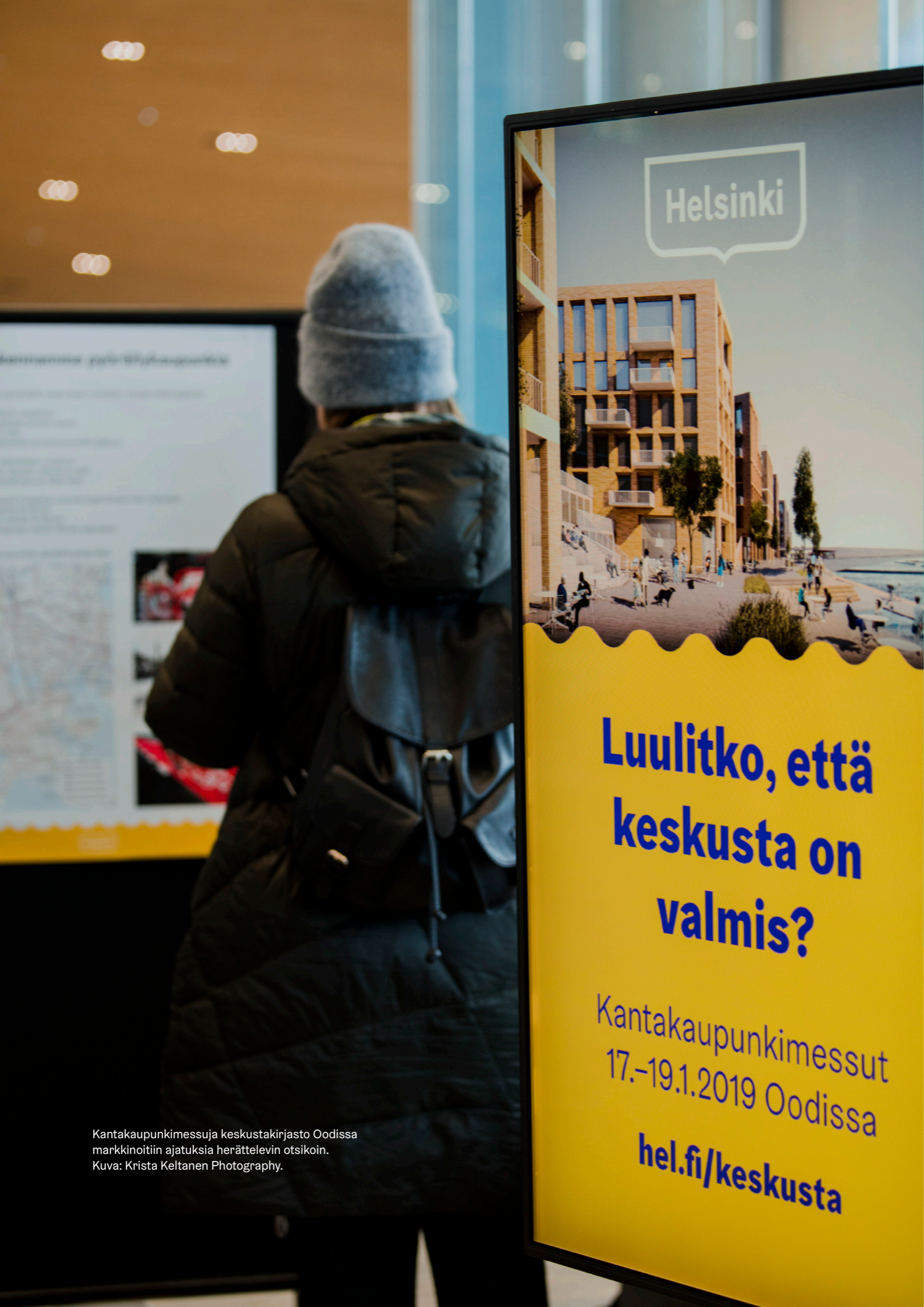
Kantakaupunkimessuja keskustakirjasto Oodissa markkinoitiin ajatuksia herättelevin otsikoin. Kuva: Krista Keltanen Photography.