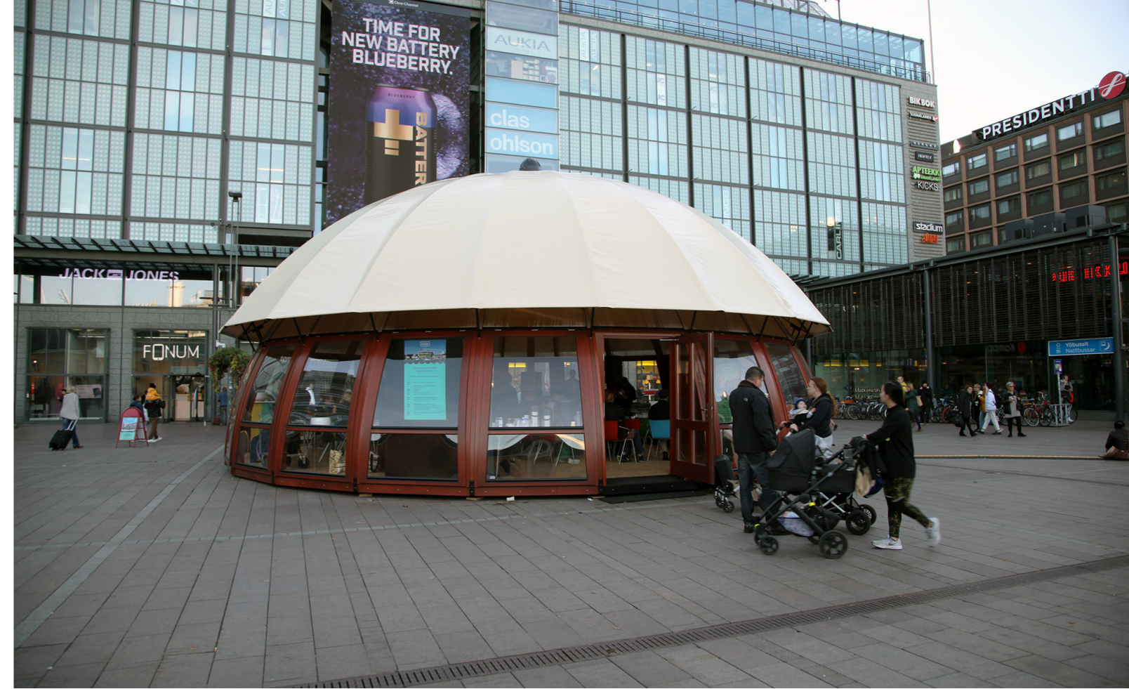
Keskustaverstas-paviljonki lokakuuisella Narinkkatorilla.

Visiotyöpajojen lisäksi järjestimme myös muita työpajoja tukemaan Keskustavisiota. Kaikille avoimessa Ideoiden kehityspaja: vetovoimainen keskusta Helsinkiin -tapahtumassa 13.9.2018 Laiturilla esiteltiin ja arvioitiin kävelykeskustan ja maanalaisen kokoojakadun ideakartoituksen tuloksia tavoitteena löytää parhaita ratkaisumalleja. Työpaja oli osa Helsinki Design Week -ohjelmistoa. Yli satapäinen yleisö pääsi kommentoimaan kahdeksan suunnittelu-toimiston ideoita keskustelun lisäksi myös omasta puhelimestaan screen.io -sovelluk-