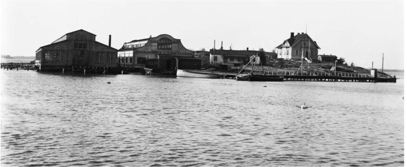
Moottoritehdas Herkules vuonna 1910. HKM