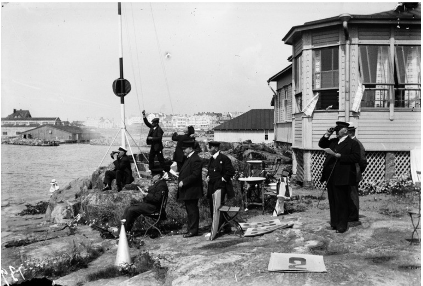
Purjehduskilpailut Liuskasaassa 1910-luvulla.