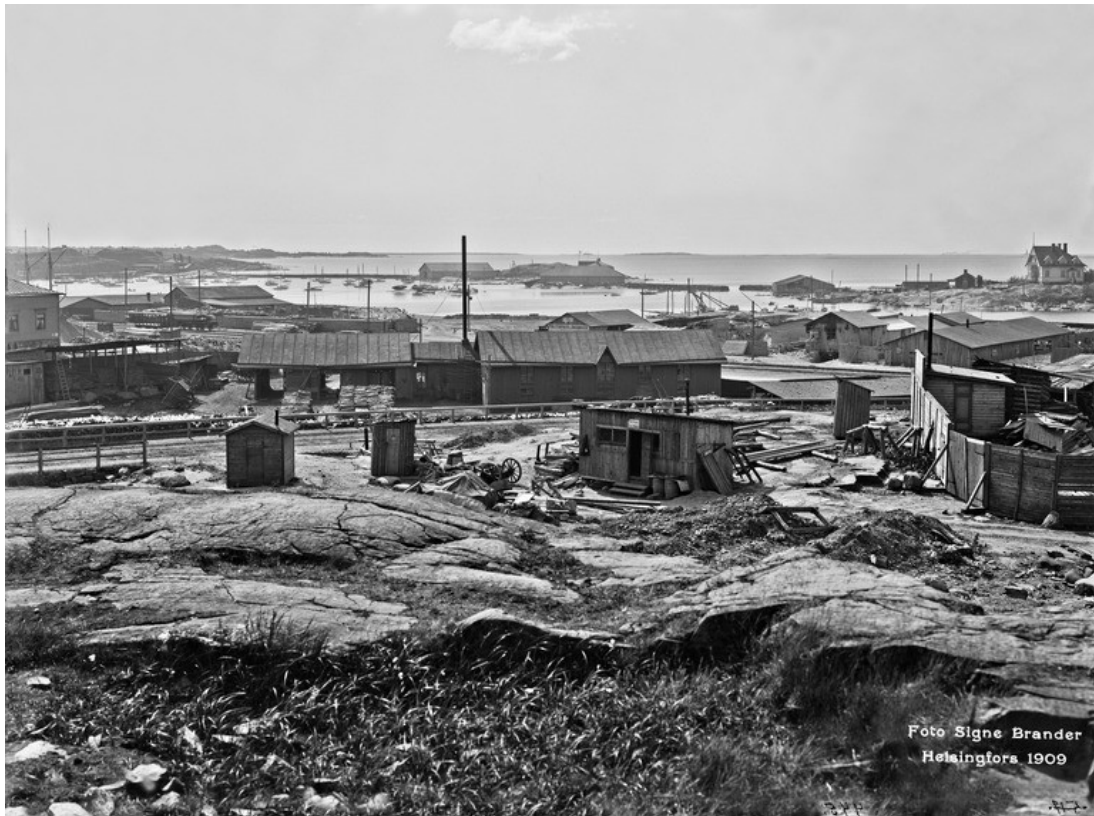
Kuva:Signe Brander 1909. HKM