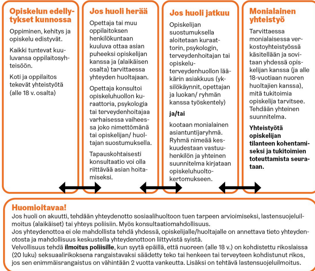
Kuva 4. Opiskeluhoollollinen polku yksittäisen opiskelijan asiassa