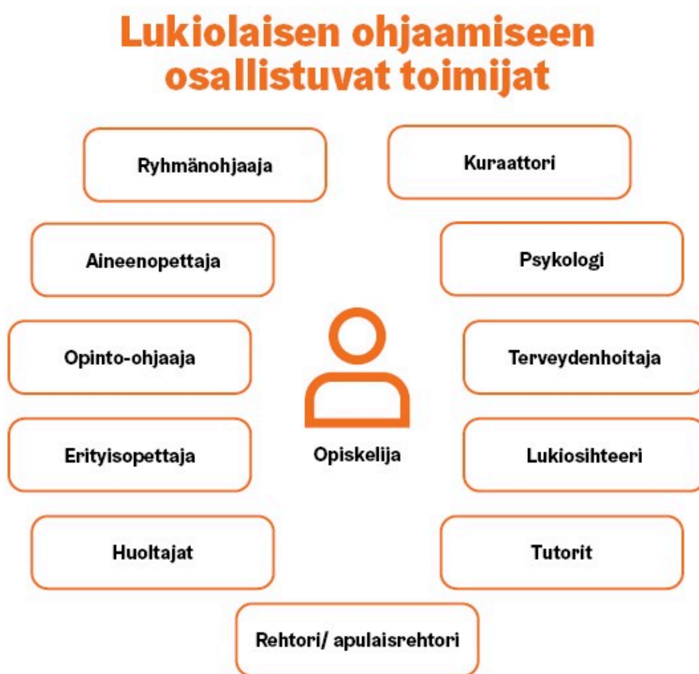
KUVA 1. Lukiolaisen ohjaamiseen osallistuvat toimijat

Helsingin kaupungin lukioissa opiskelija on oman oppimisensa omistaja ja aktiivinen toimija, ja opiskelija on ohjauksen keskiössä. Helsingin kaupungin lukioissa toteutamme koko lukio ohjaa-periaatetta, ja koko henkilöstömme on sitoutunut ohjaukseen ja ohjaa opiskelijaa. Ohjaus on tavoitteellisesti johdettua koko lukion yhteistä työtä, jossa eri toimijoiden välinen vuorovaikutus ja yhteistyö korostuvat.