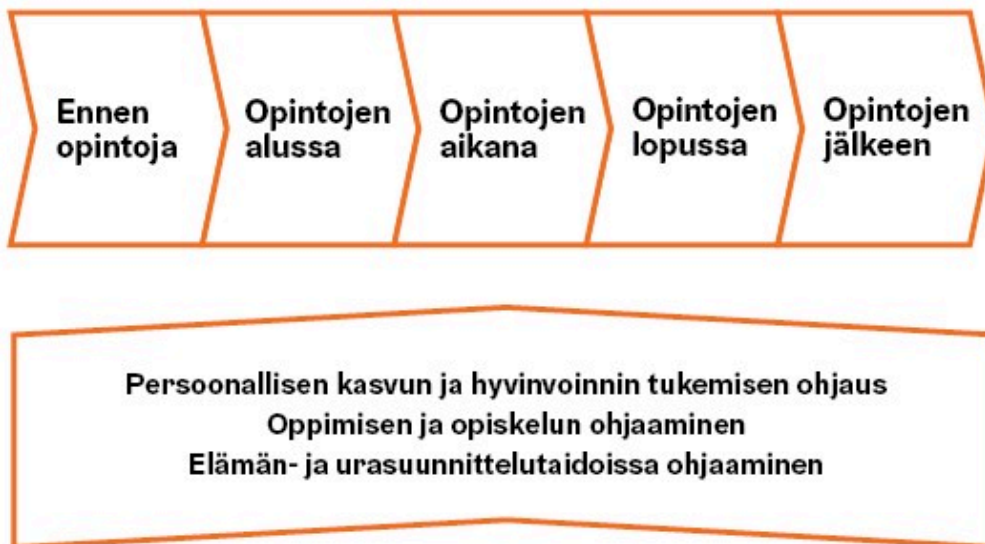
KUVA 2. Ohjauksen jatkumo