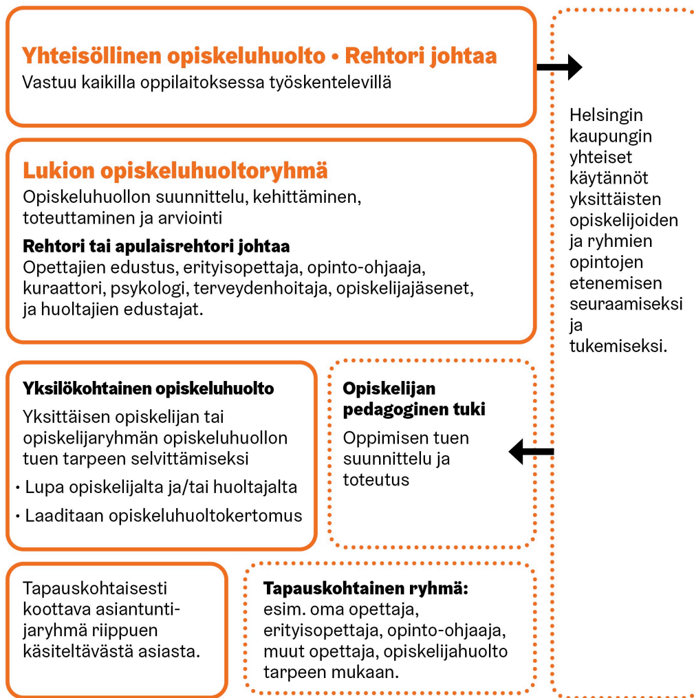
Kuva 1. Yhteisöllinen ja yksilökohtainen opiskeluhoolto

Opiskeluhoolto ja opiskelukyvyyn edistäminen sekä tukeminen (kuva 2) on kaikkien oppilaitoksissa työskentelevien ja opiskeluhoitopalveluista vastaavien työntekijöiden tehtävä. Opiskeluhoolto on osa lukioyhteisön toimintakulttuuria, ja sen toiminta vahvistaa Helsingin kaupungin lukioiden arvoja: osallisuus ja toimijuus, tasa-arvo ja yhdenvertaisuus, hyvinvointi, kestävä elämäntapa sekä tieto ja eettisyys. Helsingin kaupungin lukioiden arvoista kerrotaan luvussa 2.2. Arvoperusta.