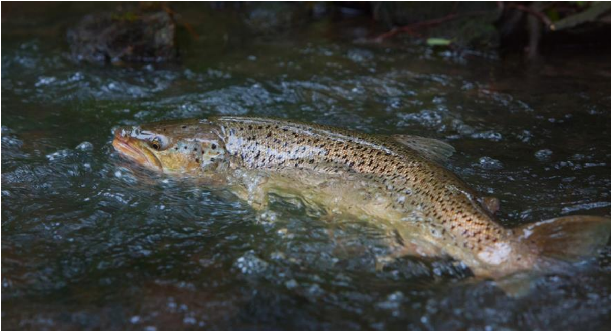
Kuva: Haagan puron taimen, Henrik Kettunen/Vaelluskala ry