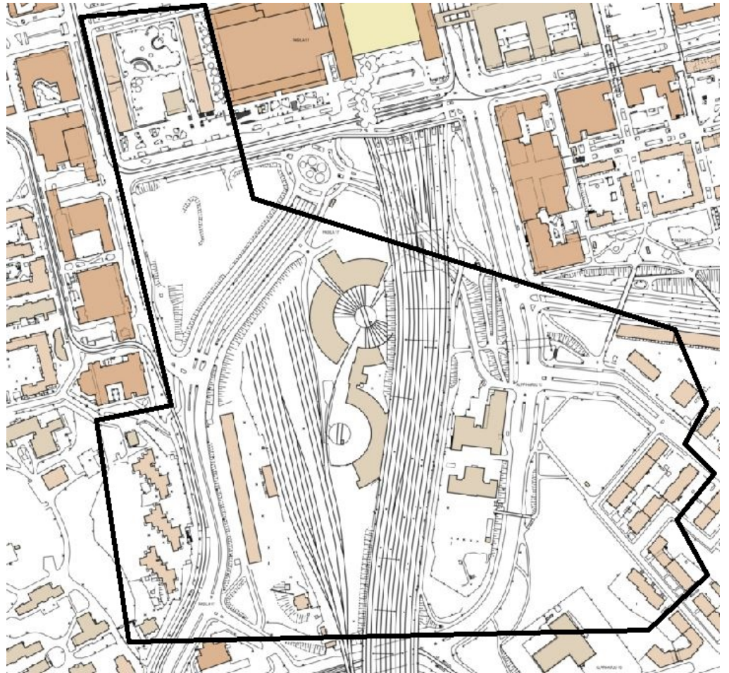
Kuva 1. Tiedotusalue rajattu mustalla viivalla (Määräys 2).