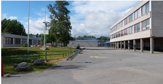
Peruskoulun sisäpiha (07/2023)

Asemakaavan muutos koskee aluetta, jossa sijaitsee Itäkeskuksen peruskoulu ja entinen Helsingin kielilukio. Koulurakennusten välissä on keskeneräiseksi jääneitä puistoalueita ja osin epämääräisiä kulkuyhteyksiä. Muutosalue ulottuu tonttirajojen tarkistuksen sekä kulkuyhteyksien ja hulevesijärjestelyiden osalta Myllypuron liikuntapuiston puolelle, mutta ei vaikuta sen toimintaan.