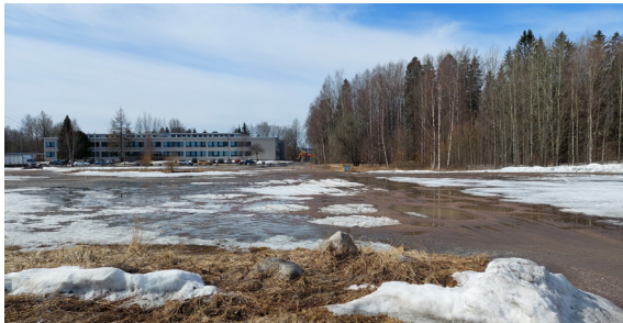
Rakentamatonta puistoa koulujen välissä (04/2022)