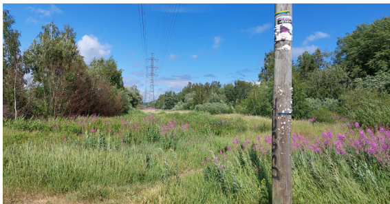
Mustapuron laakso (07/2023)