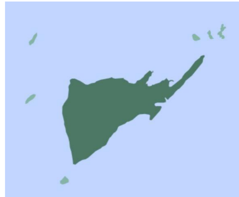
Ote yleiskaavasta. Ei mittakaavassa.