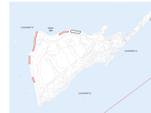
Karttaote. Ei mittakaavassa. Punaisella rauhoitetut alueet. Suunnitteluala merkattuna mustalla.

Merellisen virkistys- ja matkailu-alue Aluetta kehitetään merkittävänä virkistys-, ulkoilu-, liikunta-, luonto- ja kulttuurialueena, joka kytkeytyy mantereeseen virkistys- ja viheralueisiin. Merkitä sisältää loma-asumisen ja matkailu-alueita. Suunnittelussa tulee turvata kulttuurihistoriallisten ja maisemallisten arvojen säilyminen sekä ottaa huomioon ja turvata luonnon monimuotoisuuden, ekosysteemi- ja palvelujen kehittämisen, luonnonsuojelun ja ekologisen verkoston sekä metsäverkoston kannalta tärkeät alueet.